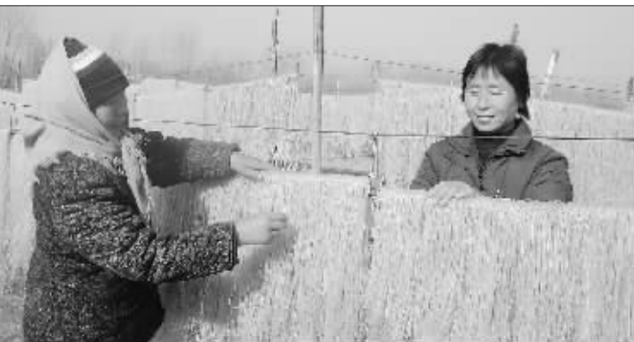
粉条加工是我市传统食品加工业。随着春节的临近,各县市区利用农民工返乡的时机,大力发展粉条加工,既保证了市场的供应,又增加了农民的收入。

会议听取了市审计局局长韩洪然同志作的《关于2008年度市级预算执行和其他财政收支审计工作报告中指出问题的整改落实整改情况》的报告。审议认为,今年8月,市二届人大常委会第十七次会议听取了审计报告,这次会议将听取审计报告指出问题的整改落实整改情况列入议程,是人大监督和审计监督相结合,增强监督实效的一个重要重要措施。从近几年的审计工作报告看,每年的预算执行都审计出一些问题,近两年我们对审计报告查出的欠缴国有土地出让金问题、市区中小学“一建五扩”存在问题进行专题监督,取得了很