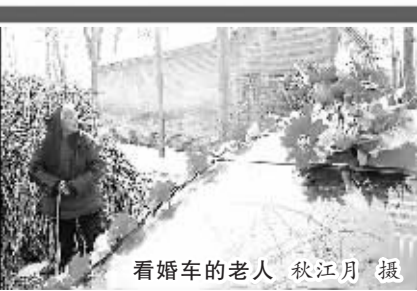
看轿车的老人