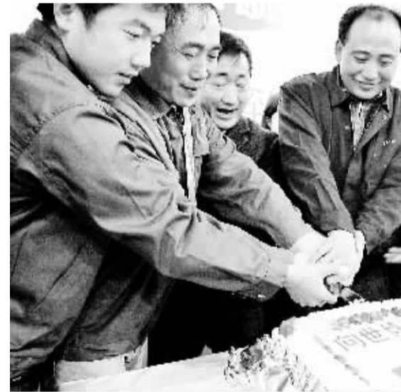
慰问坚守岗位世博会建设者