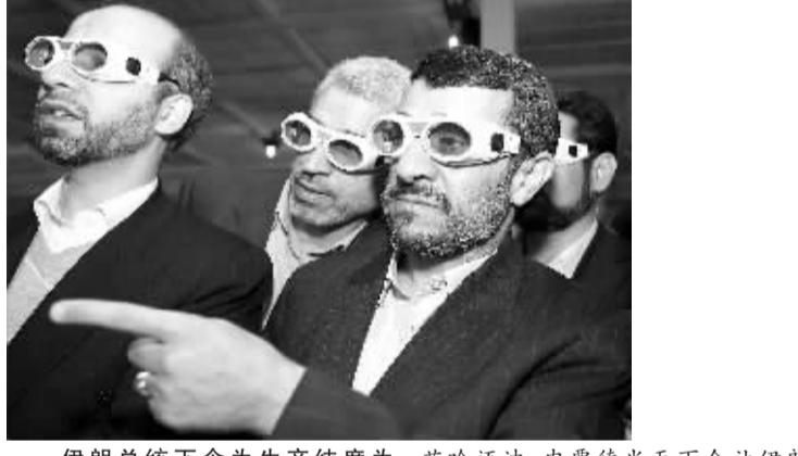
伊朗总统下令为生产纯度为20%的浓缩铀着手相关工作 2月7日,在伊朗首都德黑兰,伊朗总统艾哈迈迪·内贾德(前右)在伊朗原子能组织为生产纯度为20%的浓缩铀着手相关工作,但同时表示伊朗仍然愿意就核燃料交易问题与有关国家进行磋商。