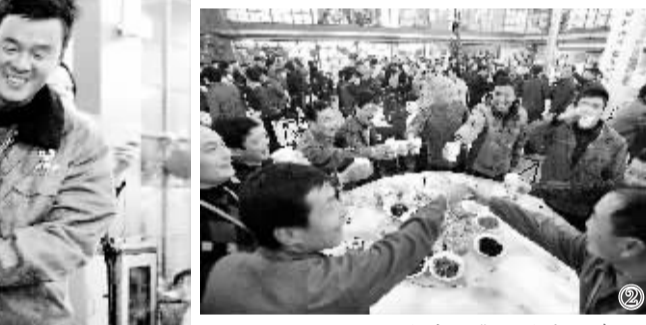
2月7日,上海建工集团千余名参加世博会园区建设的外来务工人员欢聚一堂,共进晚餐。据悉,春节期间有千余名外来务工人员放弃休假,在世博园工地上挥洒汗水。