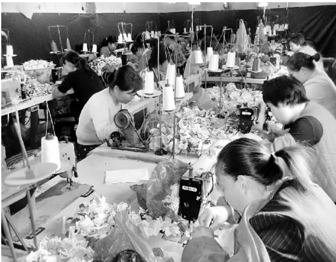
近两年来,商水县舒庄乡通过招商引资和帮助返乡农民工创业等形式,发展玩具厂、服装厂、皮鞋厂、毛衣厂、国中厂、板材加工厂等60多家加工企业,吸收当地留守妇女3000多人就业。图为骏升玩具厂的妇女正在加工玩具。