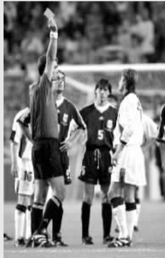
1998年世界杯:裁判向贝克汉姆出示红牌。