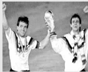
1990年世界杯:马特乌斯与队友高举大力神杯。

17. 宽容一下吧,你男朋友看这几十场球的时间加起来,都没有跟你谈恋爱以来等你试衣服的时间多!真的!