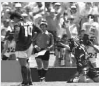
1994年世界杯:巴乔罚失点球后的落寞。