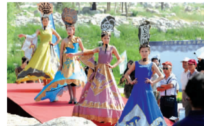
6月27日,第三届贺兰山山岩艺术节暨国际岩画学术研讨会在宁夏贺兰山脚下开幕。