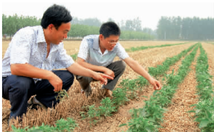
麦收过后,扶沟县抓住时机开展以除草防病治虫、施肥浇水、查苗补种为主的夏田管理。图为该县农技人员在田间了解出苗情况。