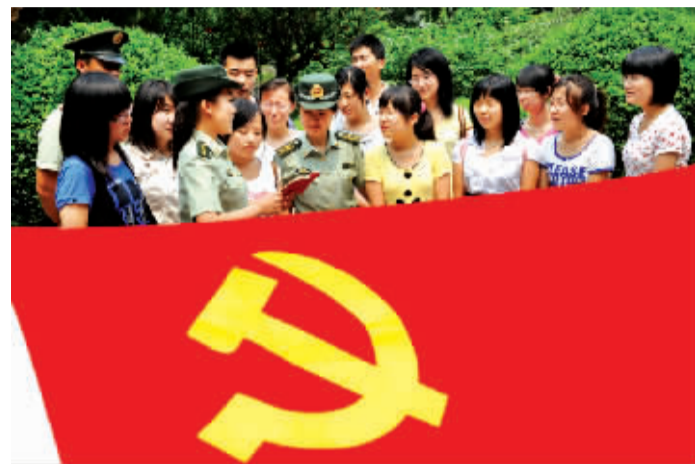
“七一”前夕,青岛科技大学新党员与共建边防官兵联合开展“重温党的历史,迎接党的生日”活动。