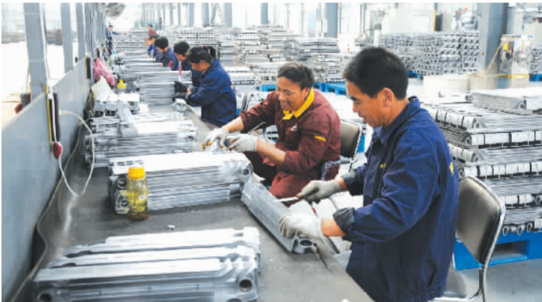
沈丘县坚持科学规划,把产业集聚区建设作为实现工业经济追赶型跨越式发展战略目标的重要平台,努力打造“一个开放、活力、创新、生态”的产业园区。图为该县产业集聚区一企业生产车间一角。

52767 人,比去年增加 6297 人,上线率 56.7%。本科线以上 32532 人,比去年增加 5448 人,与去年相比增长率是 51.8%。其中,本科一批线以上 5130 人,比去年增加 954 人;本科二批线以上 17189 人,比去年增加 2599 人;本科三批线以上 32532 人,比去年增加 5448 人。