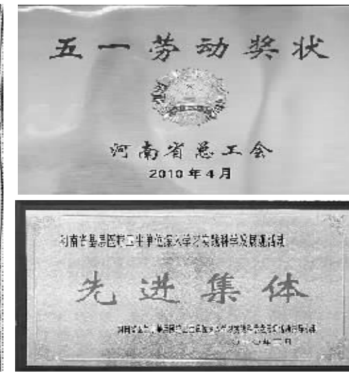
五一劳动奖状 先进集体