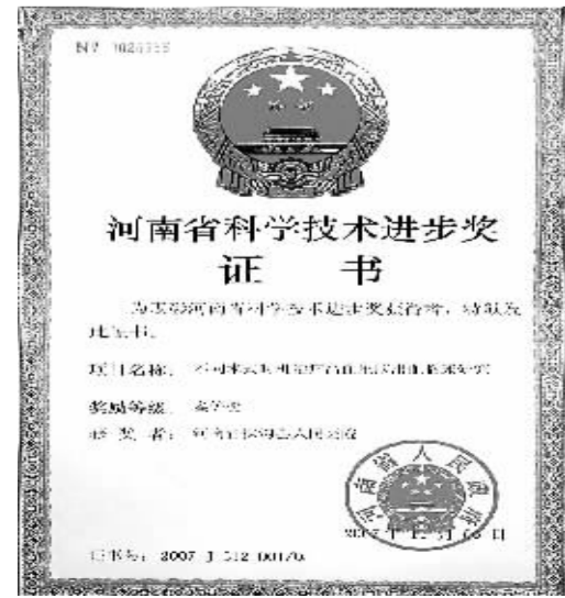
河南省科学技术进步奖证书