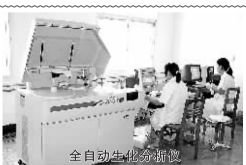
全自动生化分析仪

鲲鹏展翅凌云志,乘风破浪向未来。站在新的历史起点上,扶沟县人民医院的决策者们,正用他们智慧的眼光,大海般的胸怀和雄浑的气魄,带领全体员工,创造着新的记录,改写着新的历史,续写着更加完美的“华美”诗篇,塑造着新的与时俱进的桐丘大医风范。