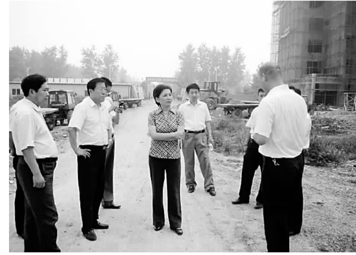
9月1日,周口市委常委、项城市委书记王宇燕深入项城市教育园区、项城市体育馆等工程项目建设工地,察看工程项目进展情况。