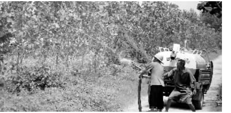
近日,贾岭镇两名员工为林木喷洒杀菌剂。针对杨树食叶害虫在周围县(市)造成的灾情,项城市日前下发通知,要求做好害虫防治工作,保护今年创建林业生态市成果。

事处被评为周口市食品安全示范乡(镇);丁集镇索庄蔬菜专业合作社、豫东养殖有限公司、食品公司屠宰场、莲花面粉有限公司等被评为周口市食品安全示范单位。