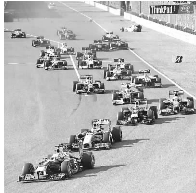
10月10日,红牛车队德国车手维特尔(前)在比赛中。当日,在一级方程式(F1)大奖赛日本站比赛中,维特尔以1小时30分27秒323的成绩夺得冠军。