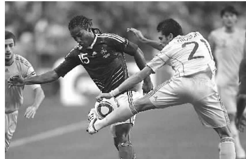
10月9日,法国队球员马卢达(左)与罗马尼亚队球员尼卢莱拼抢。当日,在2012年欧锦赛预选赛中,法国队主场以2比0战胜罗马尼亚队。