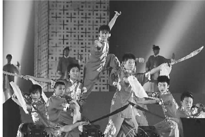
10月9日,为期三天的第八届中国沧州武术节开幕式在沧州市狮城公园举行。本届武术节共有来自韩国、刚果和中国等40多个国家和地区的600多名运动员、教练员参加。图为演员在武术节开幕式上表演武术节目。