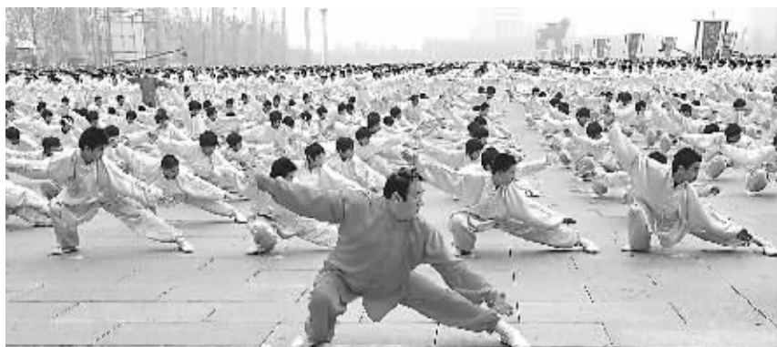
10月10日,武术爱好者在沧州狮城广场表演。当日,来自沧州市的15221名武术爱好者在沧州市狮城广场,进行了集体八极拳表演以及53种拳械门派表演,创造了中国武术拳种同时展演数量之最的上海大世界基尼斯纪录。

世界奥林匹克收藏博览会由萨马兰奇创办,迄今已举办了15届。第16届世界奥林匹克收藏博览会将于10月14日至18日在国家体育馆举办。这是继北京成功举办第13届世界奥林匹克收藏博览会后,该盛会时隔三年再度来到中国。