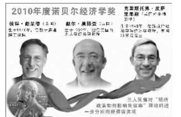
2010年度诺贝尔经济学奖得主介绍