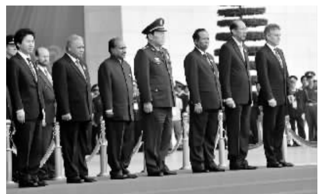
首届东盟防长扩大会议在越南河内举行 10月12日,首届东盟防长扩大会议在越南河内开幕。来自东盟10国和澳大利亚、中国、印度、日本、新西兰、俄罗斯、韩国和美国的防长或代表出席会议,就进一步深化中国在非传统安全等领域的合作、维护地区和平与稳定等问题进行讨论。中国国务委员兼国防部长梁光烈率团出席会议。