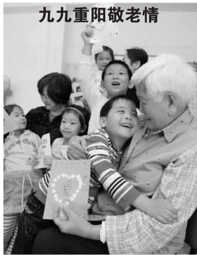
10月12日,天津市和平区第四幼儿园小朋友来到朝阳里社区,为社区老人送上“爱心祝福卡”并表演文艺节目,共迎重阳节的到来。

值得一提的是,2009年,中国对世界经济增长贡献率占50%,2005年7月人民币汇率形成机制