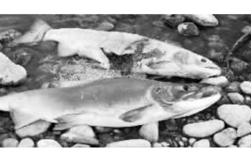
加拿大亚当斯河的红三文鱼回游 今年,亚当斯河回游的红三文鱼预计有250多万条,有报道称,这是近年来该河规模最大的红三文鱼回游活动。三文鱼有着奇妙的生命循环,三文鱼回游堪称自然界奇观。以红三文鱼回游到亚当斯河为例,每年10月左右,红三文鱼在这里产卵。小鱼苗在淡水河溪中生长一年后,顺流游到大海生活。3年后,成年的三文鱼凭借本能,逆水回游,精准地回到当年的出生地产卵。它们从大西洋进入淡水区后便停止进食,全身变得通红。在克服近500公里回游旅程中的种种艰难险阻并最终产卵留种后,它们精疲力竭而死。

当然,要让工人、农民进入公务员队伍,必须考虑到这两个阶层人群的特殊性,适当降低学历要求、年龄限制等门槛,充分尊重他们的平等竞争权利。工人、农民成为公务员后,要通过针对性、有效性的培训,使他们尽快适应环境,掌握工作方法,真正发挥出他们的才干和本领。(新华社北京10月11日电)