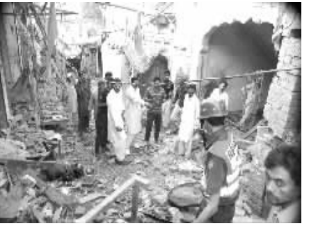
巴基斯坦东部一座神殿发生爆炸致8人死亡。10月25日,在巴基斯坦东部城市巴格伯登,人们聚集在炸弹袭击现场。据当地电视台报道,巴基斯坦东部城市巴格伯登的一座神殿25日早晨遭炸弹袭击,目前已造成至少8人死亡,20人受伤。

据新华社平壤10月24日电(记者白瑞雪 姚西蒙)朝鲜政府24日晚在平壤人民文化宫举行盛大宴会,隆重纪念中国人民志愿军赴朝参战60周年。