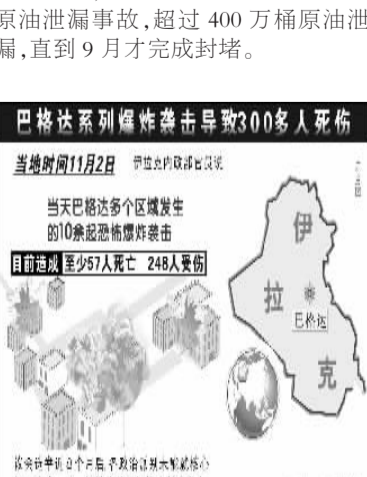
当地时间11月2日,伊拉克首都巴格达发生系列爆炸袭击,造成至少300多人死亡,248人受伤。