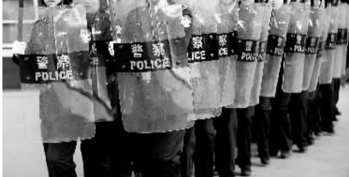
铁警练兵 备战春运 11月3日,太原铁路公安处的民警正在演练持盾队列前进。当日,太原铁路公安处的民警在太原火车站站前进行了春运前的第一次演练,展示了安检、服务、防暴等方面的技能。

酒泉是我国风力资源丰富的地区之一,可用于风电开发的面积有一万余平方公里,可开发风能达4000万千瓦以上,风电机组年有效利用小时数在2300小时以上。