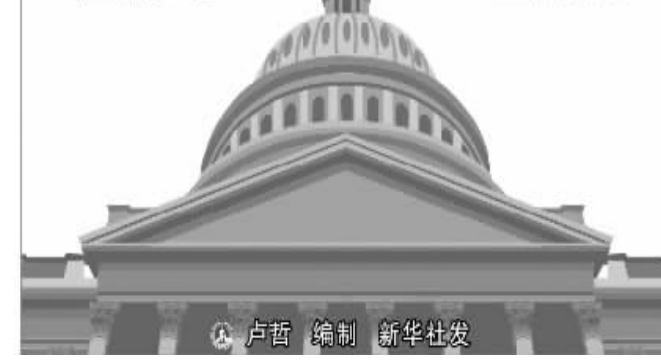
美国中期选举:选民给奥巴马“打分” 11月2日,选民在美国纽约市的一处投票站投票。当日,美国举行中期选举投票。此次选举的结果被视为检验美国总统奥巴马在过去两年施政成绩的“成绩单”。