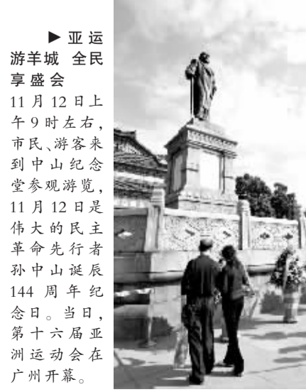
▶ 亚运羊城全民享盛会 11月12日上午9时左右,市民、游客来到中山纪念堂参观游览,11月12日是伟大的民主革命先行者孙中山诞辰144周年纪念日。当日,第十六届亚洲运动会在广州开幕。