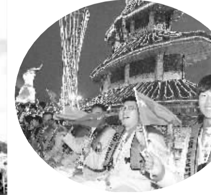
▲一江欢歌 两岸欢腾 11月12日,中国代表团成员登上花船参加珠江巡游。当日,第16届亚运会开幕式在广州举行,珠江上演广州历史上规模最大的花船巡游。