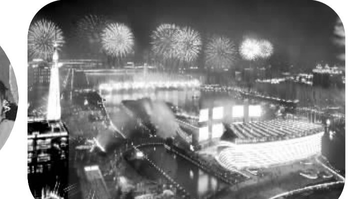
▲火树银花耀珠江 11月12日,第16届亚洲运动会在广州开幕,绚丽的开幕焰火点亮了珠江两岸。