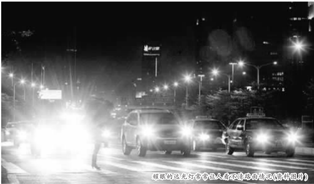
耀眼的远光灯常常让人看不清路面情况(资料图片)

市区内滥用远光灯是一种违规行为,交警部门应该狠狠地抓一抓!有些大城市为什么没有这种问题?是不是跟执法严格有关?