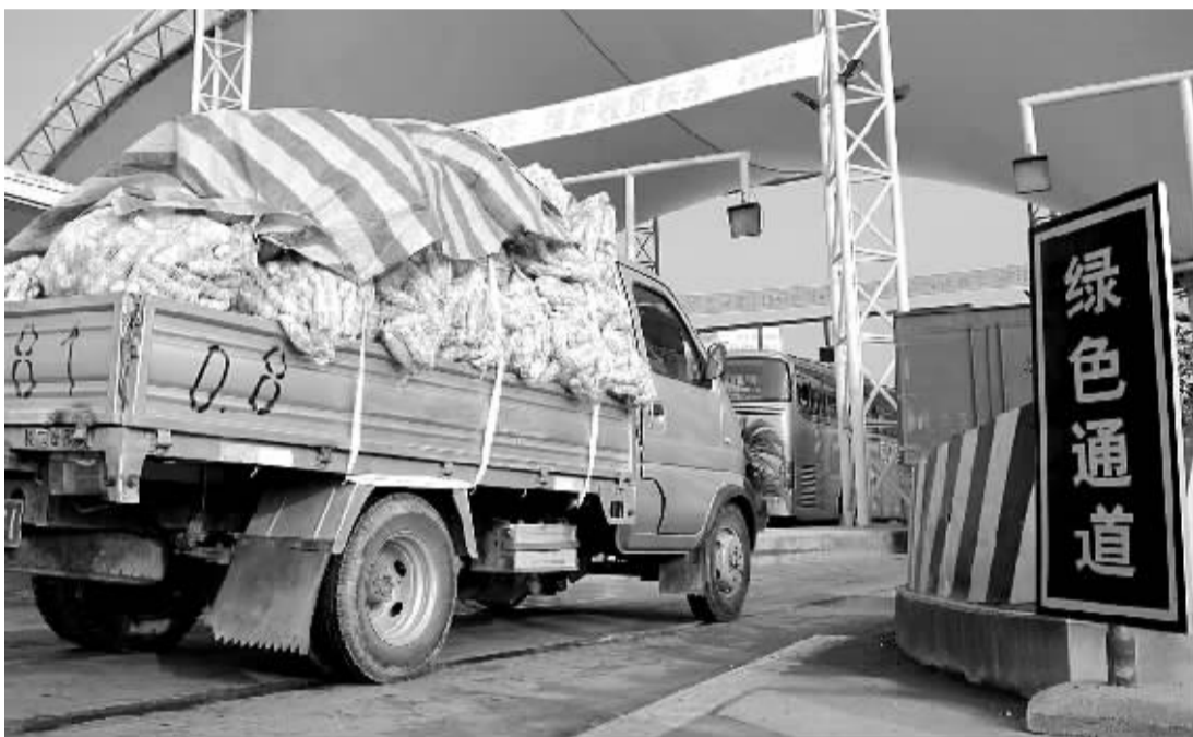
11月26日,交通运输部、发展改革委、财政部联合下发了《关于进一步完善鲜活农产品运输绿色通道政策的紧急通知》,要求从12月1日起,将免收鲜活农产品通行费范围扩大到所有收费公路,并新增了马铃薯、甘薯、鲜玉米、鲜花生等4个品种。