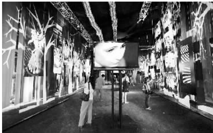
11月30日,人们在墨西哥坎昆“气候变化村”内的图片展上流连。为配合联合国气候变化会议召开,坎昆专门在酒店区附近兴建了“气候变化村”,提醒人们关注全球气候变化。