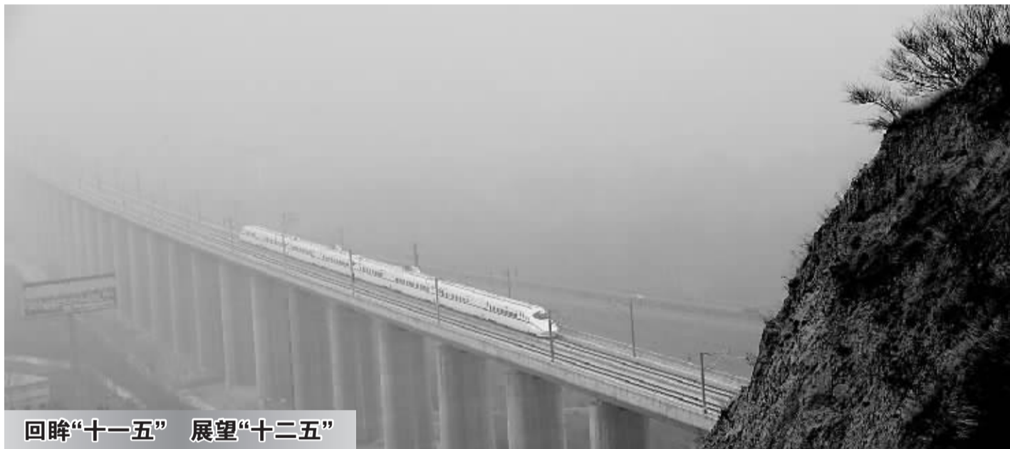
回眸“十一五” 展望“十二五”

2010年2月6日,郑西高速铁路正式开通,一辆高速列车从河南省三门峡市的山区飞速驶过。河南作为以京广线和陇海线交会点的我国铁路交通“黄金十字架”,在“十一五”期间的铁路建设迎来一个高速度、大发展、