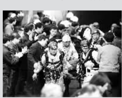
2010年3月28日,华晋焦煤有限责任公司王家岭煤矿发生透水事故,造成30余人遇难,另有115名矿工获救。这是4月5日,救援人员将获救矿工抬出井口。

从3月的王家岭矿难、4月的玉树地震、到8月的舟曲特大泥石流……许多同胞在灾难中失去生命、失去家园,灾难一次又一次地触动亿万中华儿女的心。此时此刻,党中央、国务院迅速决策、果断处理,全国各地、各行各业积极行动。在碎石瓦砾中,一双双沾满泥浆的手用力地挖掘;在风雨交加的山坡上,一抹抹“橄榄绿”用自己坚强的臂膀勇敢进行着一场又一场生命的接力;在临时搭建的帐篷里,“白衣天使”们为抢救生命而忙碌着……灾难考验着我们的智慧、信念和爱心,在灾难中我们感受到对生命的珍视和尊重。逝者已安息,生者坚强地活下去,留下我们对生命意义深远的思考,那一幕幕感人至深的场景,也许就是对“生命至上”这一崇高理念的最好诠释。