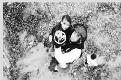
2010年6月16日凌晨,广西三江乡在3个小时内降雨超过100毫米,暴发的山洪将三江乡同化村大屯变成了“江心洲”,这个屯的一个木材加工厂内13名群众被洪水围困,存在生命危险。由于水流湍急,冲锋舟无法进行施救,广西壮族自治区防汛抗旱指挥部请求交通运输部派遣直升机救援。接到险情后,交通运输部救捞局立即启动救助预案,经评估后,决定派遣交通运输部南海第一救助飞行队飞机前往救助。这是6月16日,一名救援人员在营救被洪水围困的儿童。