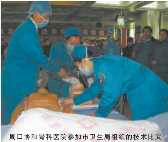
周口协和骨科医院参加市卫生局组织的技术比武

骨科进行细化,成立了脊柱病区、关节病区、创伤病区、骨病专区、显微外科病区和康复病区等六大病区。在技术上,他们秉承科技兴院、技术创新的原则,在医院几位专家带领下,各病区各专业人才梯队初步形成。目前,该院正在探索多渠道、多样灵活的人才培养和科技创新机制——