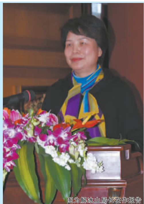
图为解冰山局长接受采访