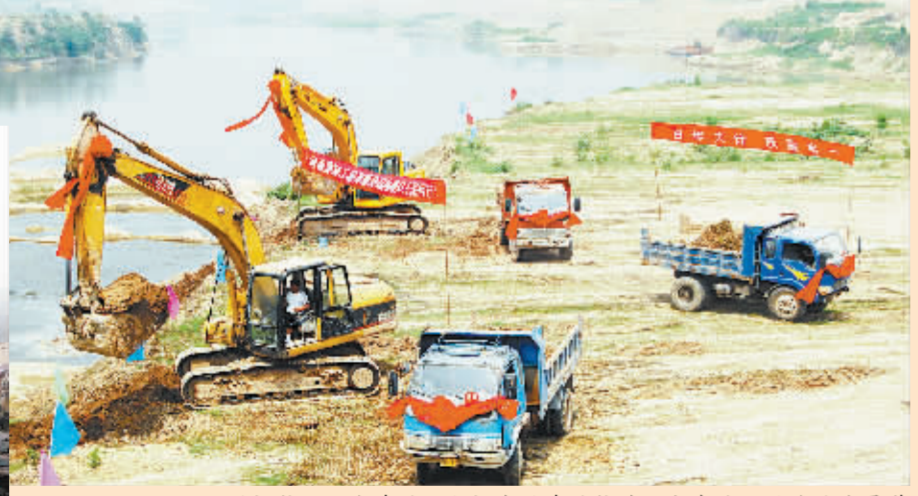
潢河航运开发建设工程河南段建设航道从大康马厂至豫皖省界,全长66.3公里,总投资为10.23亿元,建设内容包括航道、船闸、港口、桥梁工程和管理维护及服务设施,其中一期工程投资总额4.73亿元。