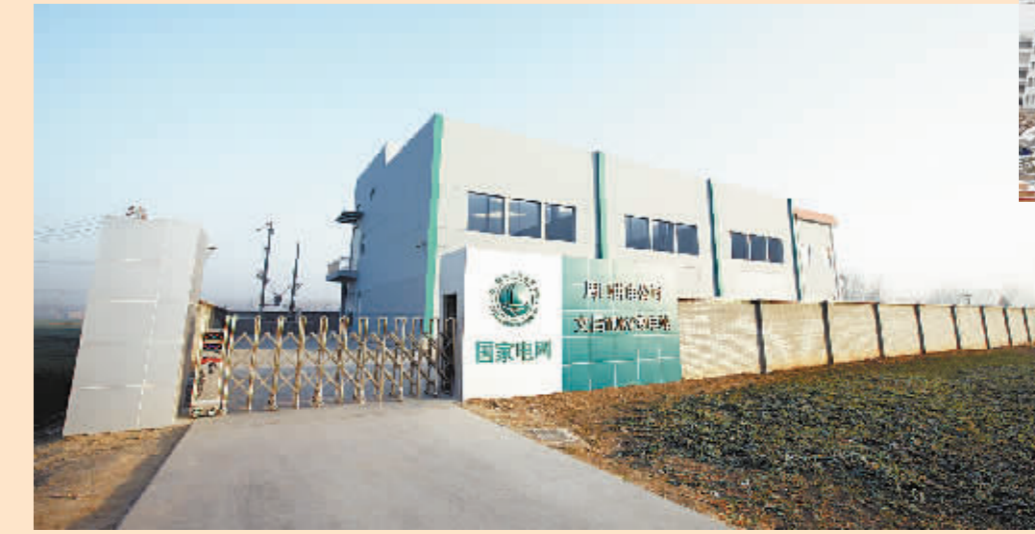
110千伏周口市东郊输变电工程计划建设50兆伏安主变3台,110千伏线路4条,10千伏线路36条,本期投资3615万元,建设50兆伏安主变1台,110千伏线路2条,10千伏线路15条,作为东新区的主供电源,该工程将保证电视台、报业大厦、周口学院等单位用电。