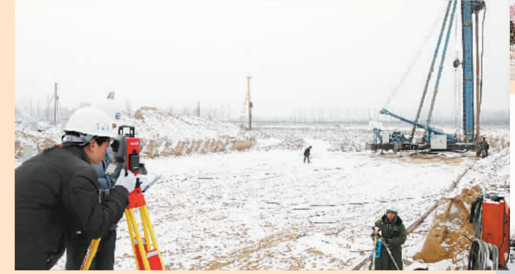
周口市体育中心占地800亩,由体育馆、体育场、综合训练馆、水上运动中心等组成,一期工程占地214亩,总投资1.4亿元,主馆可容纳5000人,已于8月份投入使用;二期工程占地360亩,设计座位3万个,建筑面积5.4万平方米,概算投资2.78亿元,预计明年7月份交付使用。