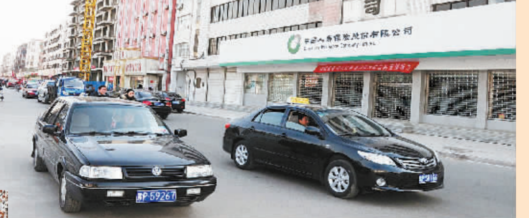
人民路拓宽改造工程西起中州路,东到大庆路,全长2.2公里,其中车行道宽12米,两侧人行道各宽4米,建设标准为二级城市次干道,工程计划分两期实施,改造内容包括电力通讯等架空线路入地,拓宽车行道,沿线配套供水、路灯、绿化等市政设施。