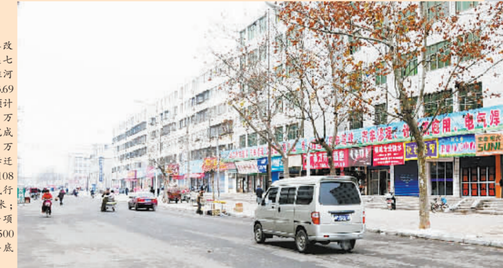
五一路改造工程北起七一路,南至淮河路,全长369公里,该路预计投资5639万元,目前已完成投资3500万元,共完成拆迁167户,51108平方米;完成行车道1500米;强电入地分项工程完成1500米,计划年底竣工。