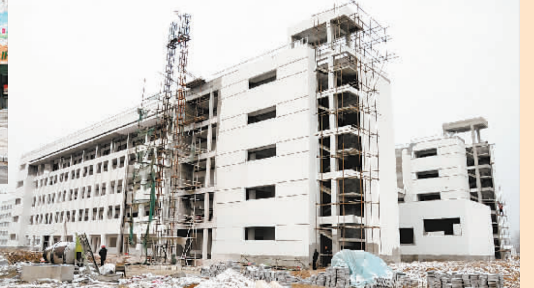
周口幼儿师范新校区占地320亩,总投资1.4亿元,总建筑面积的10万平方米,其中,一期工程总投资约9000万元,建筑面积5.6万平方米,今年上半年开工的教学楼、宿舍楼等主体工程已通过验收。