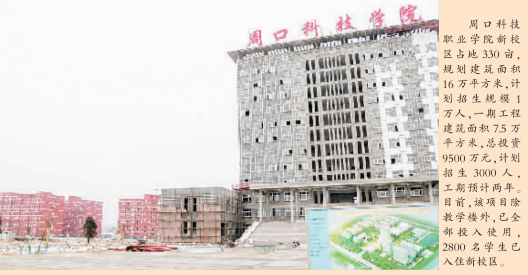
周口科技学院新校区占地330亩,规划建筑面积16万平方米,计划招生规模1万人,一期工程建筑面积7.5万平方米,总投资9500万元,计划招生3000人,二期工程除教学楼外,已全部投入使用,2800名学生已入住新校区。