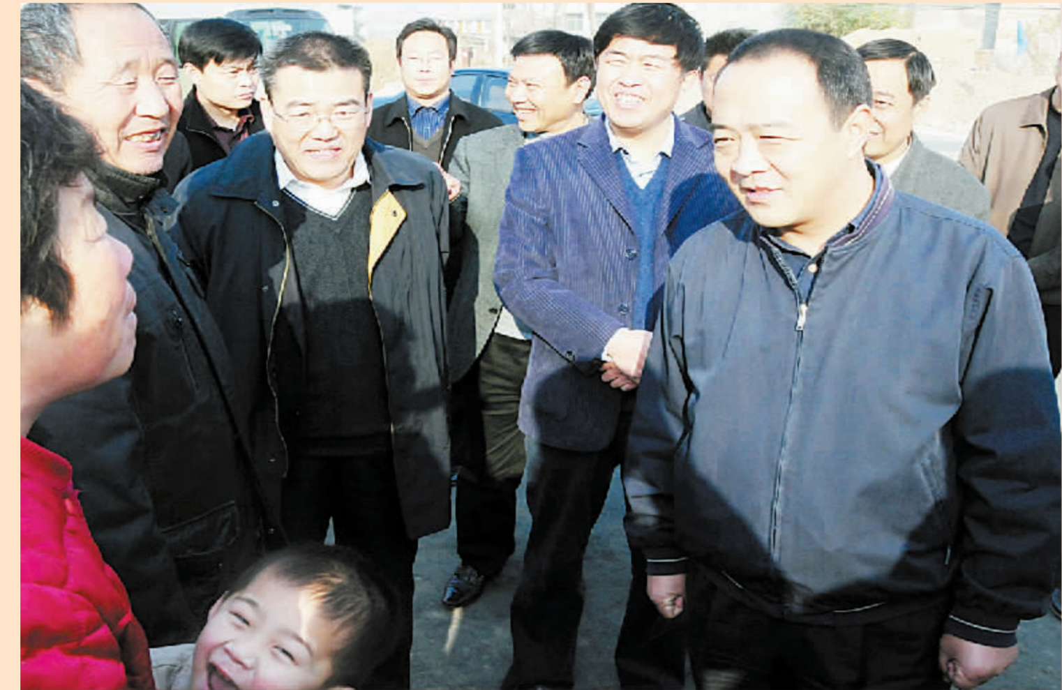
市委书记毛超峰在重点基础设施项目建设现场调研。

编者按: 大庆路新桥如期通车、东新区110千伏输变电工程建成投用……在市委、市政府年初确定的十五项重点基础设施项目建设工地现场采访,我们欣喜着全市人民的欣喜,幸福着全市人民的幸福。这些立足长远的民生工程,从不同侧面提升了城市品位,完善了城市功能,不经意间改变着全市人民的生活。 据了解,我市十五项重点基础设施项目建设总投资61.92亿元,今年计划投资32.08亿元,1-11月份完成投资39.38亿元,占年度投资计划的122.76%,其中3个项目竣工,6个项目超额完成年度投资计划,6个项目正在加快建设步伐。 今日本报刊发这十五项重点基础设施项目建设场景,向全市人民传递捷报和喜讯,并以此向各级党委、政府及奋战在一线的建设者们表达谢意和敬意。希望全市人民在市委、市政府的正确领导下,脚踏实地,埋头苦干,在新的一年里留下更加丰硕“积累”。