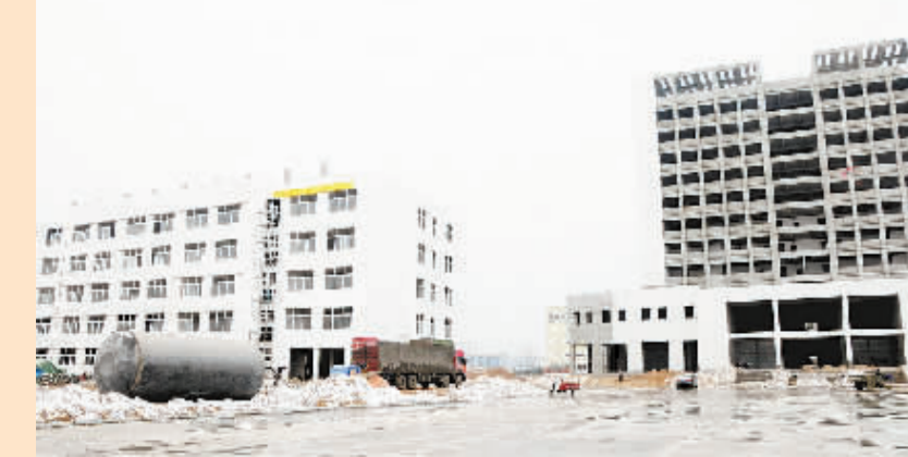
周口卫生学校新校区项目位于东新区职业教育示范基地,规划征地的500亩,其中一期工程征地的317亩,项目概算总投资2.28亿元,总建筑面积16.5万平方米,设计招生规模1万人,建设总工期3-5年。