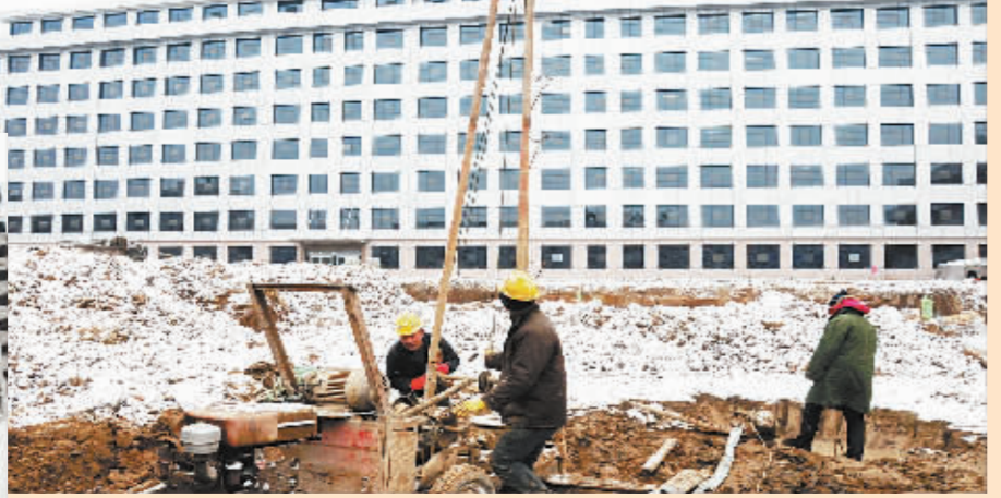
周口市中心医院新建门诊楼总建筑面积为3.5万平方米,分为地下两层,地上五层,建筑高度22.5米,地下一层为设备及其他用房,地下二层为停车场,能容纳停车位348个,主体结构形式为钢筋混凝土框架结构,预计投资概算1.4亿元。