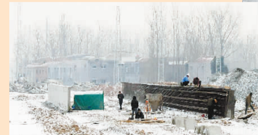
漯阜铁路复线电气化改造工程总投资60亿元,设计列车运行速度120公里/小时,并预留160公里/小时提速条件,年货物发送量可达1.6亿吨。目前,该工程已完成60%以上投资规模,预计明年上半年全线贯通。