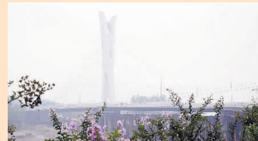
大庆路沙颍河大桥位于大庆路中段,为二级主干道,设计时速50公里/小时,主桥为整体断面,设计标准宽度32.5米,大桥全长297米,引桥为分离式断面。该桥已于今年8月份通过了验收并通车。