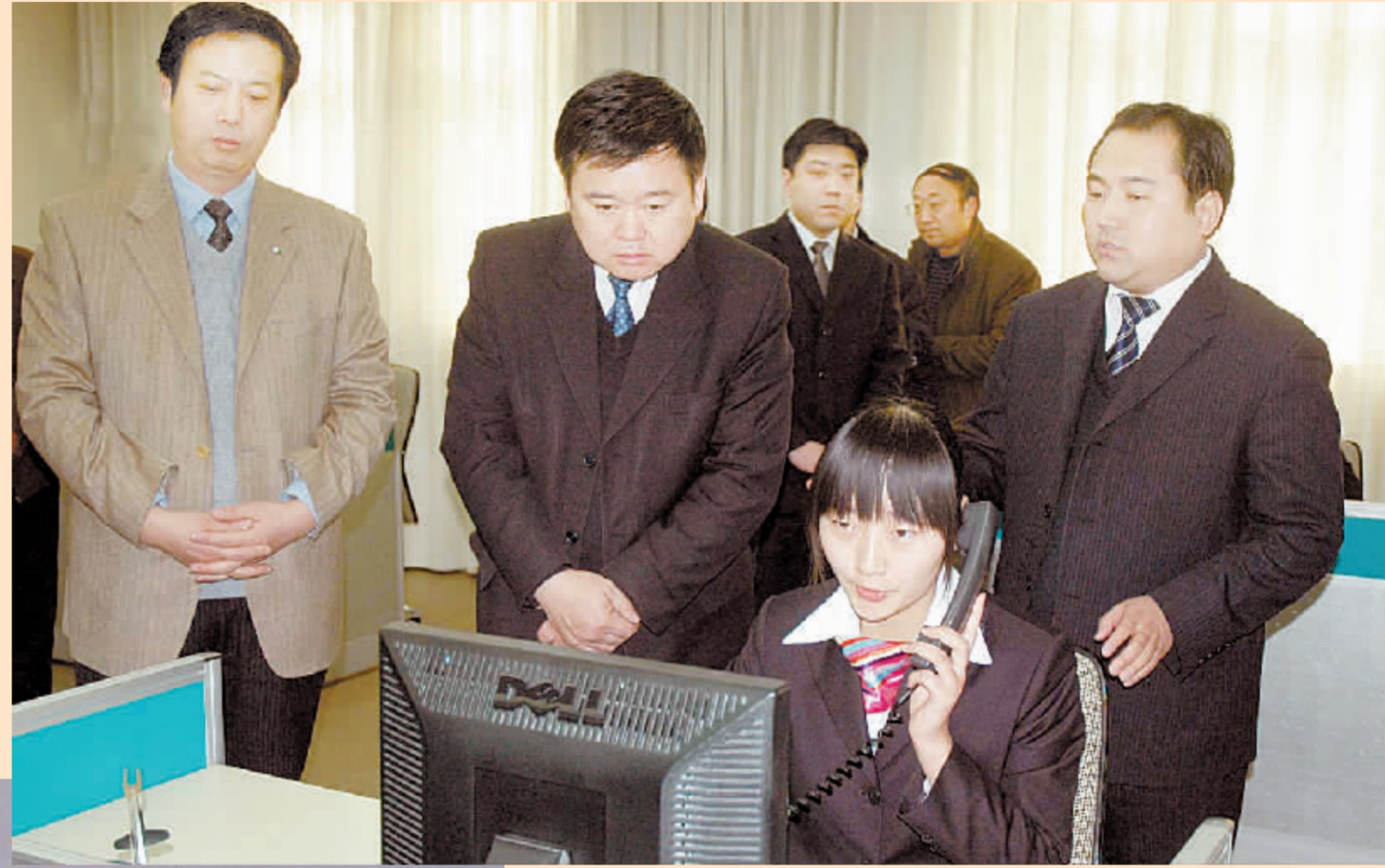
市长徐光在重点基础设施项目建设现场调研。