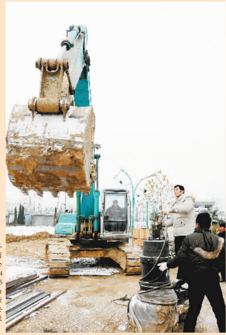
周口市沙南污水处理二期工程服务于沙南城区和商水城区,面积69.74平方公里,其中一期工程已于2004年建成投产,日处理规模为5万吨;二期工程建设规模为新增日处理污水7万吨,新建污水管网92公里,主要新建污水处理厂1座,敷设配套污水管网等。