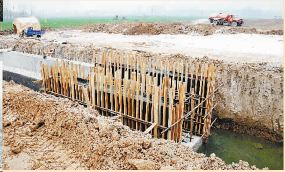
郸城至淮阳一级公路工程是河南省一级公路规划网中的重要组成部分,路线全长52公里,全线新建中桥8座,停车区1处及服务管理设施等,设计速度80公里/小时,路基宽24.5米,行车道宽2x3米,主路肩宽2x0.75米,计划年底建成通车。