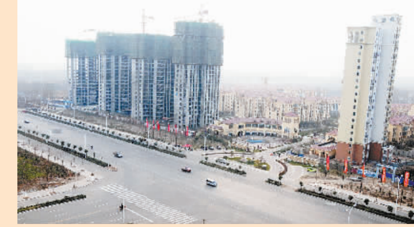
周口大道全长17.25公里,是中心城区重要的交通主干道。改造拓宽一期工程总长度7.9公里,道路红线宽度55米,两侧绿线宽度各30米,按城市快速路标准设计,同时配备完善的雨水、污水、供水等市政管线及路灯照明设施。