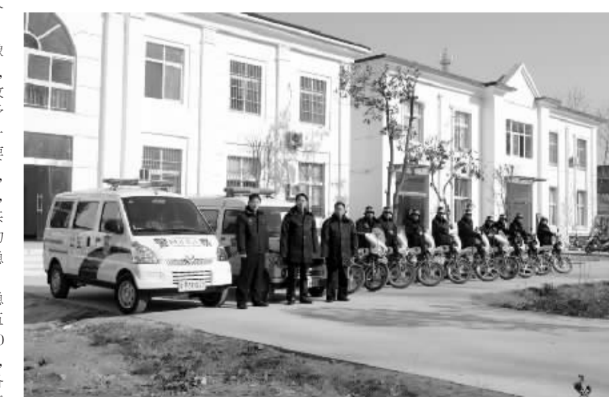
重拳打击犯罪。图为该镇领导看望慰问治安巡警。

天3次巡逻,每天每人每车补助30元,并做到巡逻范围每天覆盖全镇。二是坚持社会治安社会治,全民参与共建平安。创新工作思路,寻找村级站岗巡逻的新方法,做到行政村有人站岗、有经费作保障,并建立长效机制。三是抓亮亮,重在坚持。2008年全镇36个行政村92个自然村全部统一高标准安装了路灯,在全县率先实现了全镇亮化工程。同时想办法解决了电费问题,保证了有灯必亮。四是健全综治网络,该镇配合电信部门对全镇36个行政村全部安装了电信技防设施,并在政府所在地、省道207、槐刘镇的主要部位、三分之一以上的行政村安装了电子摄像头。对稳定隐患实行月排查、月报告和零报告制度,及时沟通信息,对重点人员实行一盯一管理。同时,把维稳工作责任层层分解、落实到人,在全镇范围内布上了一张社会的、科技的、稳定的保险网。及时调处,化解矛盾纠纷。该镇高度重视稳定问题,积极争取40多万元资金改建了法庭,高标准建设了群众