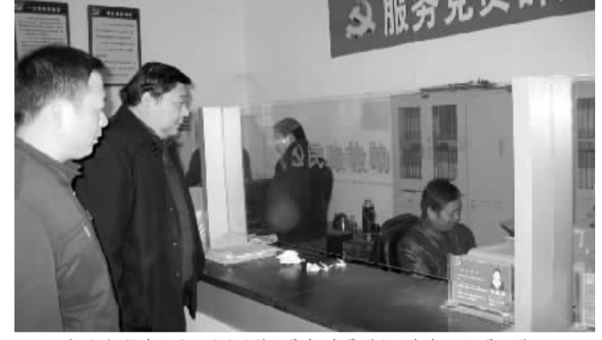
化解矛盾,构建和谐。图为该镇领导在“党员群众服务中心”指导工作。

设网,打击了犯罪分子嚣张气焰,营造了人人讲安全、社会才平安的浓厚氛围。三是加强信访稳定工作。四是强化措施,狠抓安全生产工作。落实民族宗教政策,促进民族团结。一是将民族宗教政策法规纳入党委宣传计划,利用广播、电视等媒体,广泛开展民族宗教政策、民族团结进步先进典型和事迹的宣传活动,在全社会营造了维护民族团结、促进社会和谐的良好氛围。二是在少数民族群众中大力开展“提素质、树形象”自我教育活动,有力促进了全镇居民讲文明、谋发展良好风尚的形成。三是建立健全各级民族宗教工作领导小组及民促会、民调会等组织,构建了民族团结进步工作的网格化格局。四是充分发挥少数民族和宗教人士在维护民族团结、和谐发展,无重大群体性民族冲突和纠纷事件。广泛动员社会力量,激活社区文化。该镇组织人员把退休职工、退休干部和社区内有热爱文艺表演的人才,吸纳到社区文化组织中,深入社区进行演出。同时,该镇借助县城总体规划,先后修建街心公园4处,健身长廊900米,休闲广场