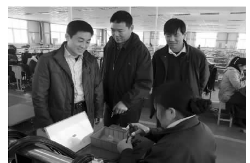
加大招商引资力度。图为该镇领导在凯旺电子了解企业生产情况。

抓规划,强调因地制宜。该镇根据当地实际提出“一年打基础,两年上台阶,三年求跨越,五年铸辉煌”的奋斗目标,实现“三个递增、三个达到、两个确保”,即农业增加值年递增8%以上,工业增加值递增15%以上,农民人均纯收入递增8.5%以上;城镇化率达到65%,居民劳动就业率达到95%,群众对“平安老城”的满意率达到95%以上;确保青少年100%读完九年制义务教育,全镇农民100%加入新型农村合作医疗。该镇聘请专业人员对全镇进行整体规划,城区面积由原来的3平方公里扩大到8平方公里。抓整治,改变镇容村貌。该镇开展“清