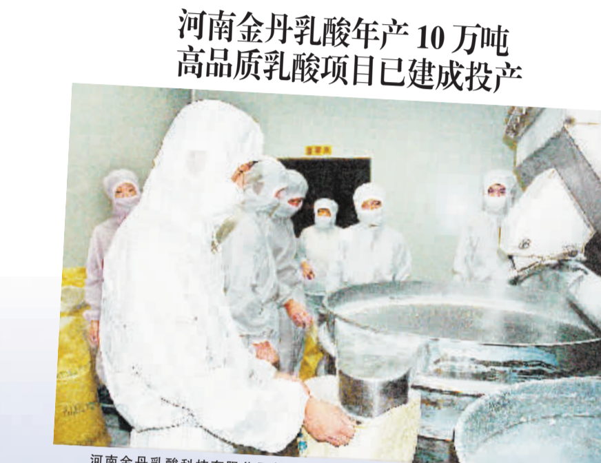
河南金丹乳酸年产10万吨高品质乳酸项目已建成投产 河南金丹乳酸科技有限公司年产10万吨高品质L-乳酸工程项目是周口市2010年“双十五”重点工程之一，总投资3亿元，购置发酵罐、管式反应器等主要先进设备260台(套)，配套建设环保及公用工程等，形成年产10万吨高品质L-乳酸产能。该项目为我市首次采用国内自主创新技术生产L-乳酸的项目，在世界上独家采用玉米湿磨生产L-乳酸，属技术国际先进水平。该项目2010年10月获河南省科技进步一等奖。该项目工程建成后，乳酸产量将达到世界第一，且可新增销售收入9.5亿元，新增利税1.5亿元。该项目17个工程节点已于2010年10月底全部建成投产运行，各项经济技术指标全部达标。该项目的建设必将推动乳酸行业的发展，消除环境“白色污染”，发展潜力巨大。