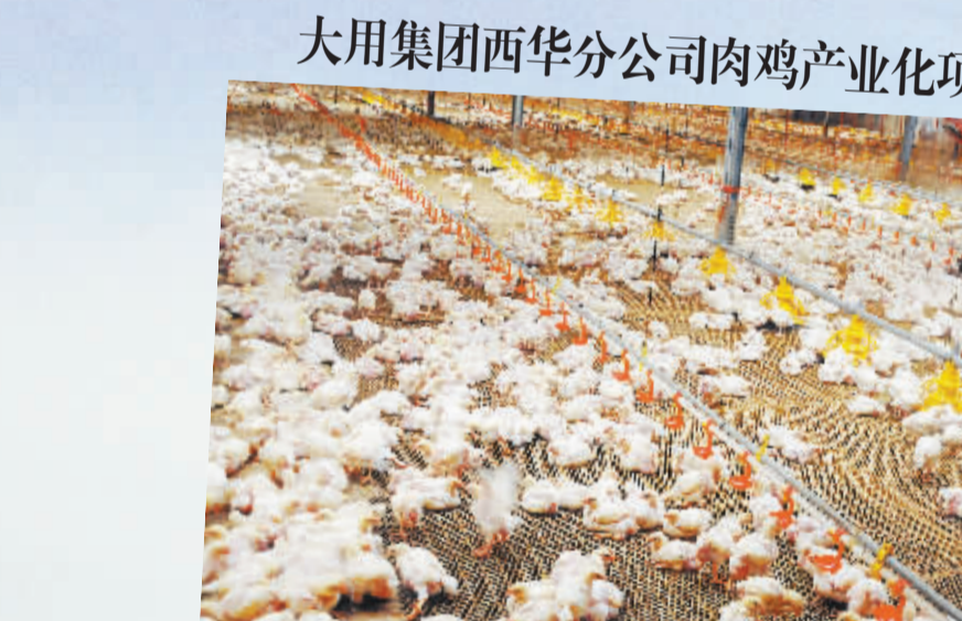
大用集团西华分公司肉鸡产业化项目 河南大用邦泰食品有限公司西华分公司肉鸡产业化项目是农业产业化项目，也是西华县具有里程碑意义的标志性农业产业化龙头项目。该项目总投资8亿元，建设内容为：肉鸡屠宰加工厂1座，饲料加工厂1座及肉鸡养殖小区30个。项目全部建成后，年产量可达42亿元，利税1.5亿元，预计可提供就业岗位4500个，年可增加农民收入上亿元。2010年计划投资4亿元，全年完成投资3.6亿元，占年度投资计划的90%。目前，已建成肉鸡养殖小区15个，肉鸡屠宰加工厂、饲料厂和孵化厂主体工程及配套设施、宿舍楼、餐厅已完工。该项目达产后，对促进西华经济社会发展、膨胀全市经济总量、实现周口追赶型跨越式发展具有重要意义。