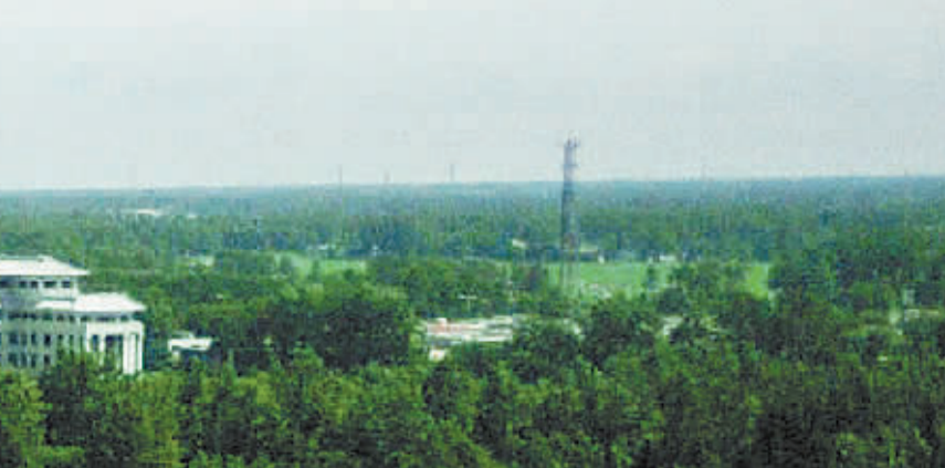
景鹏肉类加工项目已竣工投产