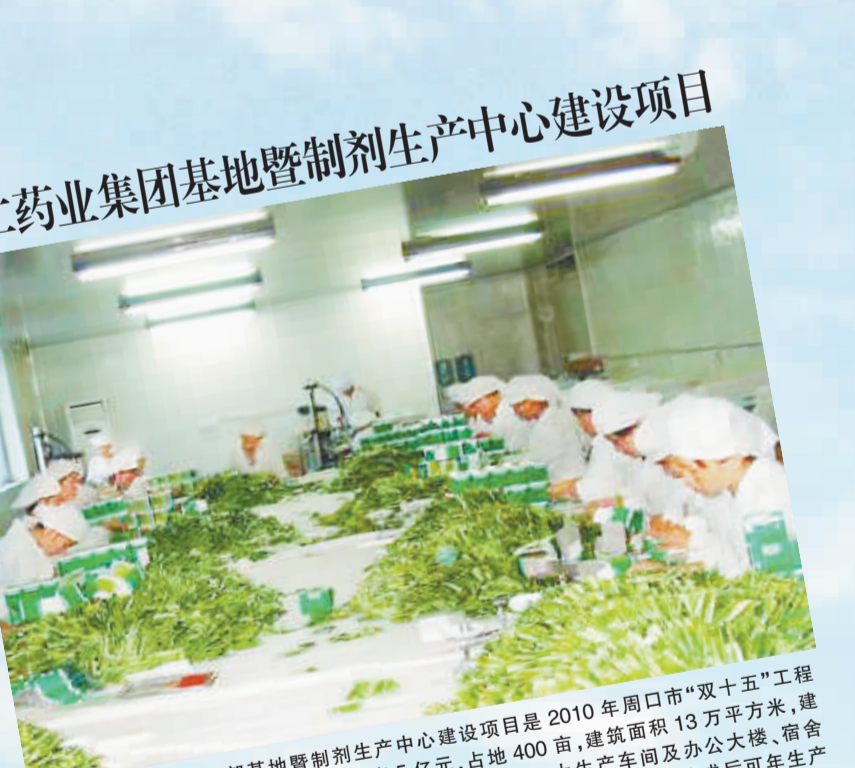
辅仁药业集团基地暨制剂生产中心建设项目