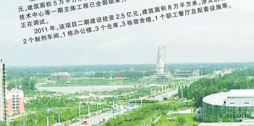
景鹏肉类加工项目已竣工投产