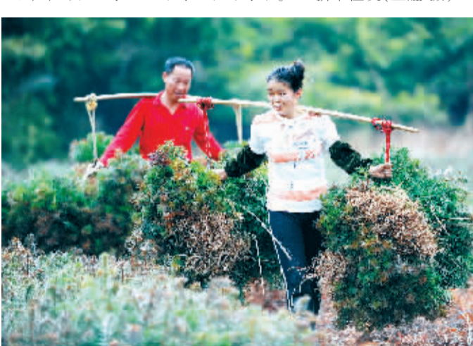
近日,江西省定南县天九镇的田间地头一片忙碌,当地农民正抓紧晴好天气收获苗木。村民介绍,目前苗木迎来销售旺季,供不应求,销往广东、福建、广西等省份。