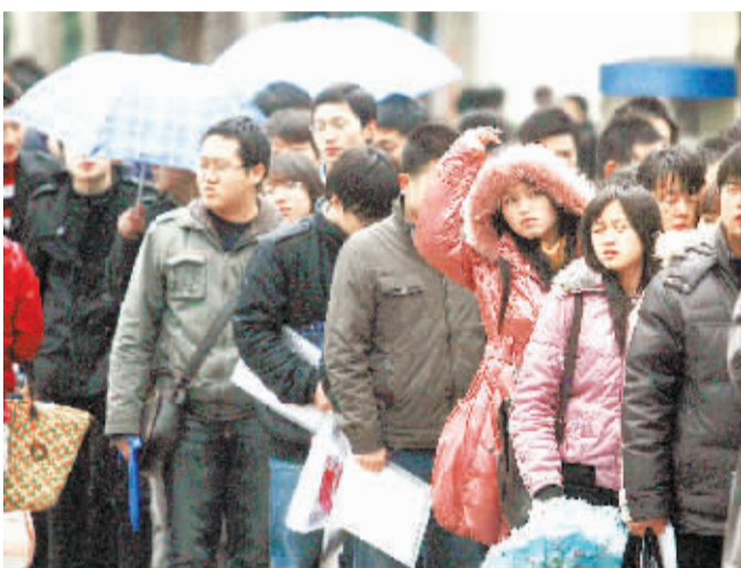
2月27日,湖北省2011年新春大型人才招聘会在位于武汉的华中科技大学光谷体育馆拉开序幕。