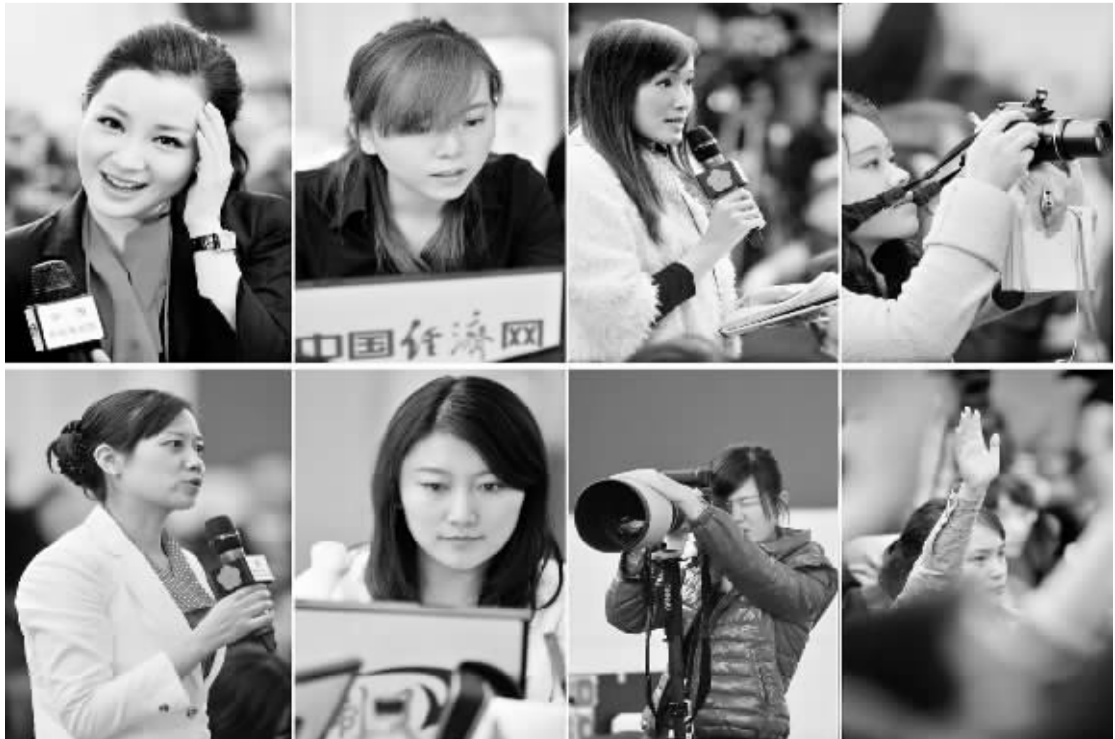
3月7日,八名女记者在记者会上采访的拼版图。