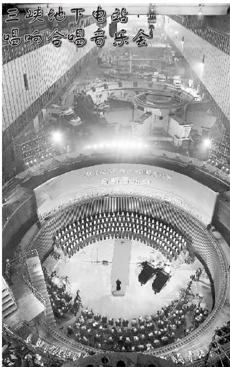
4月15日,三峡大学教师合唱团和学生合唱团以及三峡建设者合唱团的成员们在三峡地下电站28#机组发电机电定子铁芯内放声歌唱。当日,为迎接三峡地下电站即将投产发电,庆祝五一国际劳动节,三峡建设者合唱音乐会在湖北省宜昌市三峡工地地下电站28#机组发电机电定子铁芯内隆重举行。在建的三峡地下电站位于右岸大垭山山体,设有6台70万千瓦的水轮发电机组。首批3台机组投产在即。

“虽然当前中国经济没有我国滞胀,但是也不能掉以轻心,还是要未雨绸缪,因为影响经济平稳运行的不确定、不稳定因素仍然较多。要按照党中央、国务院关于经济工作的总体部署抓好落实,保持政策的连续性、稳定性,提高针对性、有效性。”盛来运说。(据新华社北京4月15日电)