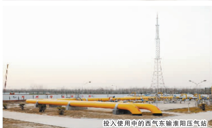
投入使用中的西气东输淮阳压气站

近年来,淮阳县在市委、市政府的正确领导下,深入实施“旅游带动、工业强县”发展战略,以招商引资和项目建设为抓手,加大投入,优化服务,强力推进产业集聚区建设,取得了明显成效。淮阳县产业集聚区总规划面积15平方公里,现已建成7平方公里,入驻企业82家,形成了塑料制品、纺织服装、农副产品加工三大产业集群。2010年,完成固定资产投资28.6亿元,同比增长48%;扩展建成区2平方公里,新入驻企业36家,新增就业6000人;实现工业总产值55.2亿元,同比增长76.4%;实现营业收入54亿元,同比增长98%。2010年5月,被评为“全省先进产业集聚区”;2010年8月,被确定为“全省创建国土资源集约节约利用试点集聚区”;2011年2月,被评为“河南省十快产业集聚区”。