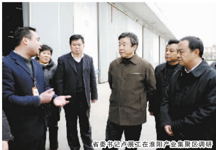
省委书记卢展工在淮阳产业集聚区调研