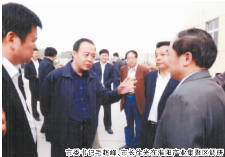
市委书记毛超峰、市长徐光在淮阳产业集聚区调研