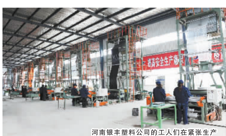
河南银丰塑料公司的工人们在紧张生产