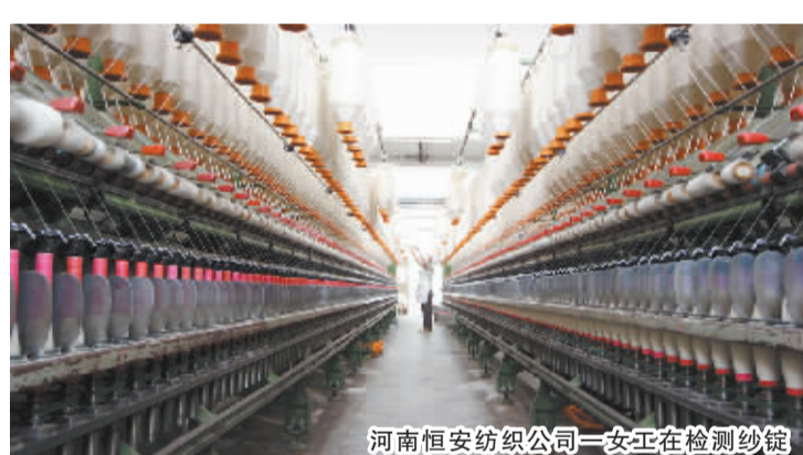
河南恒安纺织公司一女工在检测纱锭