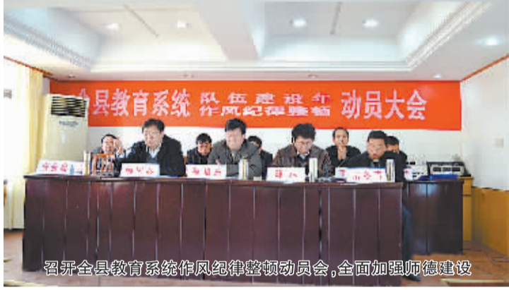
召开全县教育系统作风纪律整顿动员大会,全面加强师德师风建设