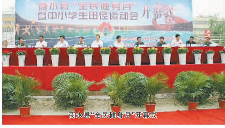
商水县“全民健身月”开幕式