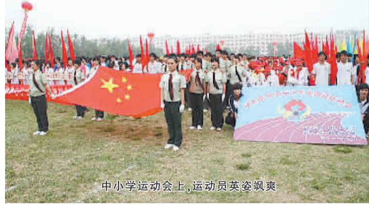
中小学运动会上,运动员英姿飒爽