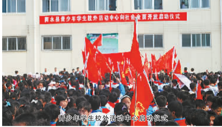
青少年学生校外活动中心启动仪式