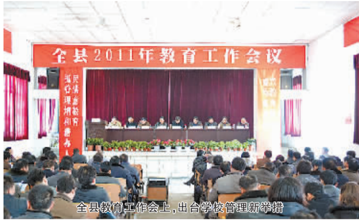
全县教育工作会议上,出台学校管理新举措