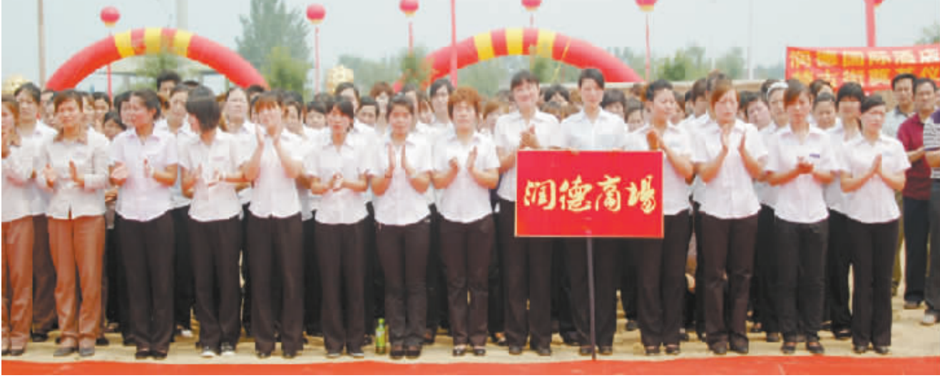
热情的润德集团员工