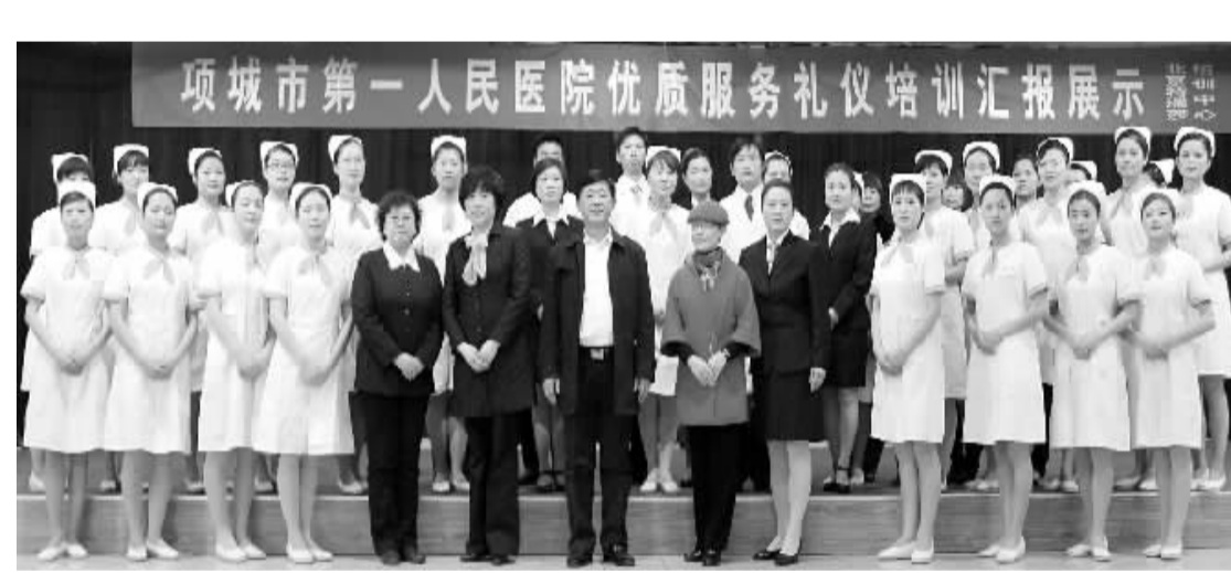
项城市第一人民医院优质服务礼仪培训汇报展示

在项城市第一人民医院,服务不再是医务人员流于形式的口号,门诊设“导医便民服务站”,使患者再也没有了到医院里“摸不着东西南北”的窘迫。医院推出了电话预约挂号服务,使许多患者消除了排队挂号的无奈,上门服务则使老弱病残