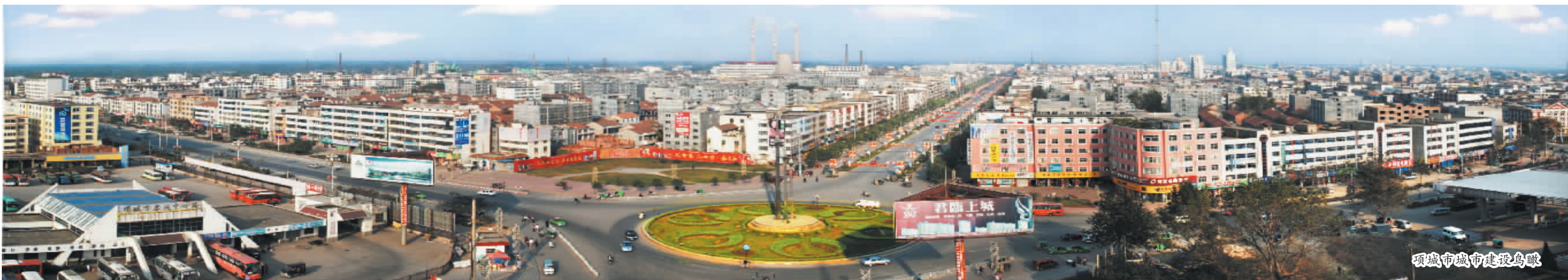
项城市城市建设鸟瞰