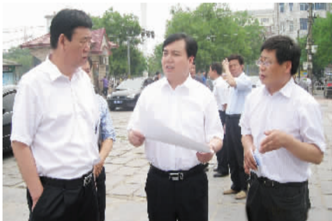
项城市代市长黄贵伟察看项城市城市建设