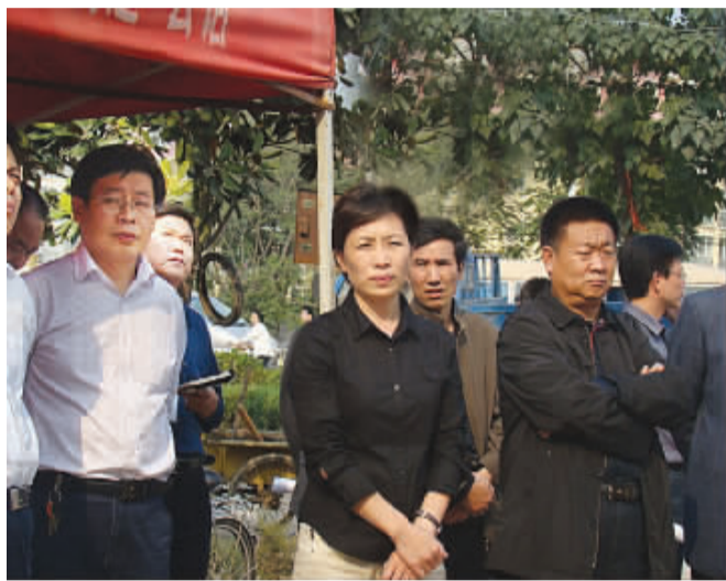
周口市委常委、项城市委书记王宇燕察看项城市“三城联创”