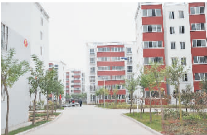
新建成的项城市保障性住房