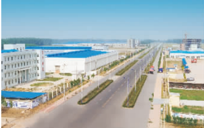
发展迅猛的项城市产业集聚区

2010年,对于刚刚成立的项城市住房和城乡建设局来说是意义非凡的一年。这一年,项城市住建局党委班子在市委、市政府的正确领导下,在上级主管部门的支持和帮助下,团结带领全局干部职工,发扬敢为人先、顽强拼搏的精神,用辛勤耕耘的汗水,谱写了一曲绚丽的华章,全市住房和城乡建设事业突飞猛进,取得了骄人的辉煌业绩。