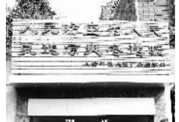
重庆遇高温天气 市民防空洞纳凉 7月4日,市民从重庆市人民广场“人防工程纳凉点”进出。重庆市近日持续晴热、高温天气,重庆市气象台连续发布了数个橙色高温预警,市政府已提前在全市开放107个纳凉点,供市民避暑纳凉。

连日来,四川连续遭受强降雨天气,1日的暴雨造成汶川“生命线”213国道中断,大量沙石阻塞公路。2日这条道路一度抢通,进入汶川的车辆开始放行。但3日的降雨造成这一道路再度中断。