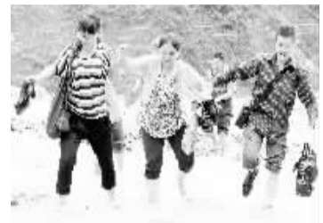
7月4日,汶川213国道一处损毁点,当地居民相互搀扶通过泥石流冲断的路面。

据新华社四川映秀7月4日电(记者陈健)连接成都与汶川的“生命线”213国道4日仍在抢通,由于4日凌晨当地再次出现强降雨,罗圈湾大桥附近路段出现新的垮塌,成为受灾最严重的路段。现场抢通人员表示,新增的泥石流和