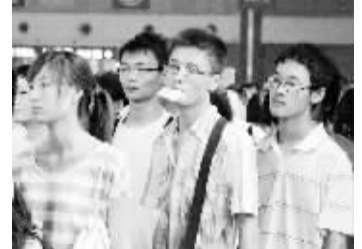
郑州火车站迎来学生民工流 7月4日,在郑州火车站,几名大学生旅客准备进站。当日,随着各高校陆续放假,郑州市火车站客流明显上升。根据郑州火车站计划,2011年暑期运输期限自7月1日起至8月31日止,共计62天,将以学生流、民工流和观光旅客流为主。