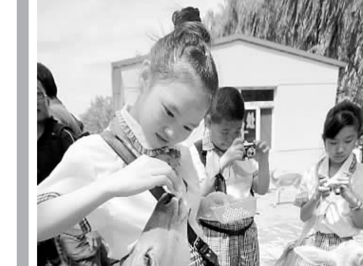
7月7日,来自天津红桥区实验小学的“爱护动物小使者”们与小鹿亲密接触。