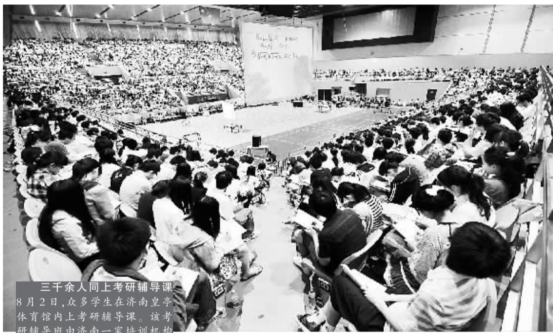
三千余人同上课研辅导课 8月2日,众多学生在济南皇亭体育馆内上课研辅导课。该考研辅导班由济南一家培训机构组织,为期1个月,共有约3500名学生同时上课,其中80%的学生来自济南的高校。主办方在体育馆内安装了3块投影屏,以便馆内每个角落的学生都能看到授课内容。不少参加辅导班的学生表示,时下就业压力较大,所以放弃了宝贵的暑假,投身到考研辅导大军中来,期待在来年的研究生入学考试中顺利过关,为将来成功就业添一份筹码。

美国航天局喷气推进实验室1日发表新闻公报说,这是天文学家首次“可以确定地”宣布太空氧分子的存在。欧洲航天局则在新闻公报中说,搜寻太空氧分子的长期努力终于告一段落,天文学家现在“可以松口气”了。 在太空中,单个氧原子很常见,在大质量恒星周围更是普遍存在,但占地球大气约1/5的氧分子在太空中却一直与天文学家玩“躲猫猫”。2007年,瑞典“奥丁”射电天文望远镜据称发现过太空氧分子,不过这项发现无法得到证实。 美国航天局喷气推进实验室“赫歇尔”项目科学家保罗·戈德史密斯等人在美国《天体物理学杂志》上说,他们推测,在太空中,氧原子会与尘埃结合凝固成水冰,一旦受光线照射,就会蒸发成气体并形成氧分子,因此或许能在恒星形成区域找到氧分子。 戈德史密斯等人将目光投向距地球约150光年的猎户座星云,最终借助2009年发射升空的“赫歇尔”望远镜,成功找到目标,不过数量不多,与氢分子的比例大约是1比100万。戈德史密斯说:“18世纪70年代就发现了氧分子,但直到230多年后,我们才最终可以很确定地说,太空中存在这种非常简单的分子。” 由于氧是太空中第三多的元素,天文学家猜测,其分子形式应该大量存在。他们计划在其他恒星形成区域继续搜寻氧分子。