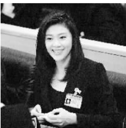
颂莎·素拉暖当选泰国新一届全国议会下议院国会主席 8月2日,在泰国曼谷,为泰党总理候选人英拉·西那瓦出席泰国新一届全国议会下议院首次会议。当日,泰国新一届全国议会下议院首次会议选举颂莎·素拉暖为下议院议长暨国会主席,乍龙·旺阿南翁及威素·差纳伦为副议长。