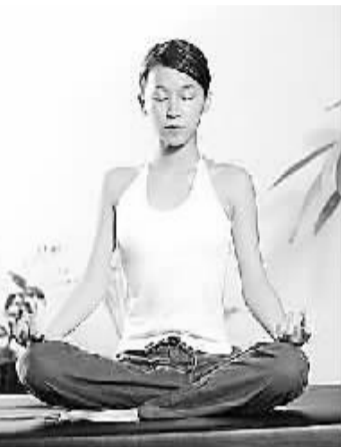
静心养气,也是抵御酷暑的好办法。(资料图片)