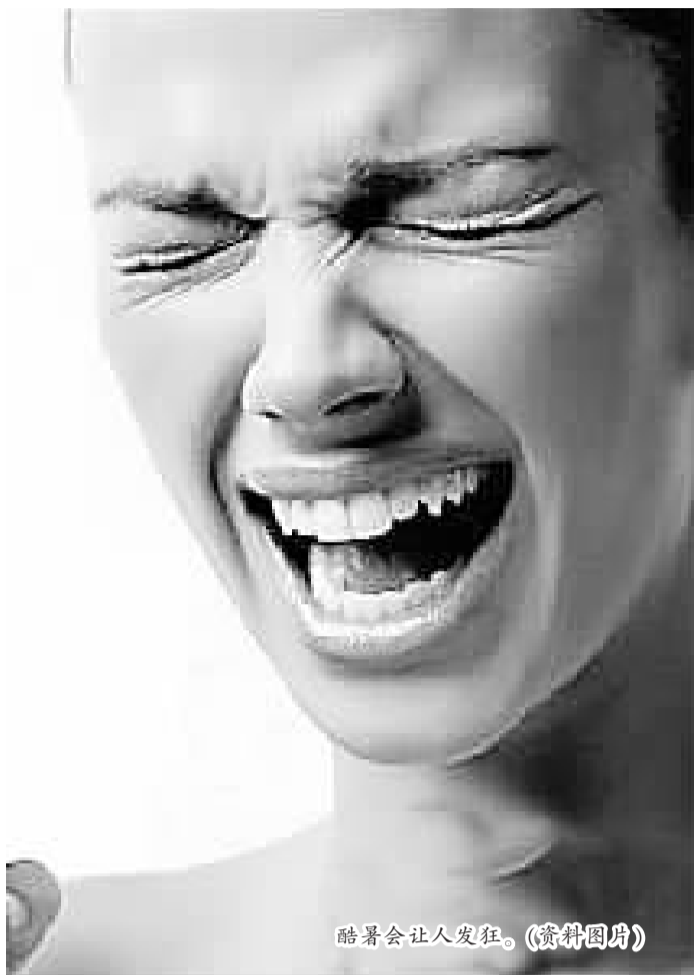
酷暑会让人发狂。(资料图片)