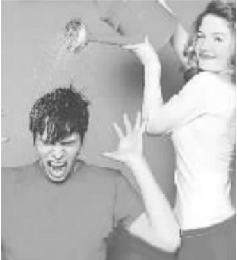
烦躁的时候要适时给自己浇凉水。(资料图片)