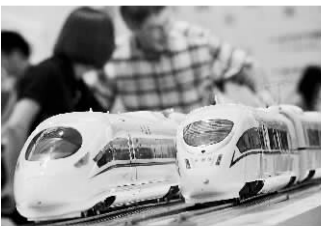
中国国际轨道交通展上海开幕 8月23日,观众在“CRHS CHINA 2011国际轨道交通展”上参观。当日,“CRHS CHINA 2011国际轨道交通展”在上海新国际博览中心开幕。来自世界各地的400家轨道交通行业供应商展示了其顶尖产品、最新技术和解决方案。