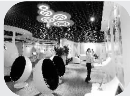
天津国家数字出版基地云计算中心即将投入使用 8月22日,天津国家数字出版基地云计算中心创新体验中心已布置完成,即将对外开放。当日,天津国家数字出版基地云计算中心各种设备完成最后调试,将于8月29日正式上线服务。作为国内首家数字出版云服务提供商,云计算中心提供整合了软件、计算、存储、网络资源的IT服务,推动天津国家数字出版基地智能化、信息化的发展。

据新华社伦敦8月22日电 新一期英国《自然·材料学》杂志刊登报告说,研究人员发现了一种新的材料处理方法,可以像画画一样在金属化合物材料上“描绘”出具有超导性能的电路,还可“擦去”电路中需要修改的部分。意大利和英国研究人员报告说,这种方法使用铜、镧和氧元素组成的金属化合物材料作为“画布”,用X射线束作为“画笔”,射线束所到之处,材料中的氧原子排列顺序会发生变化,相应部位会获得超导性能,最后可由多个这样具有超导性能的“线条”组成超导电路。此外,如果电路需要修改,可以对相应部位进行加热,从而“擦去”那些不再需要的电路连接。超导是材料在某些条件下失去电阻的现象,这时电流可以毫无阻力地传播,没有任何能耗。参与研究的伦敦大学学院教授加布里尔·埃普利认为,本次发现可用于方便地制造超导电路,对于研制新一代电子元件具有重要意义。