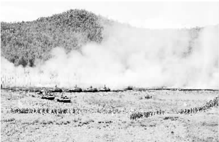
武警森林部队举行“绿色卫士-11”演习 全面检验保卫生态安全能力 8月23日,武警森林部队的官兵正在进行灭火演习。当日,武警森林部队在黑龙江大兴安岭地区举行“绿色卫士-11”灭火实兵演习,黑龙江、内蒙古、吉林森林总队和森林指挥部机动支队、直升机支队共3800多名官兵异地同步参加演习,投入各类装备60余种3000多台(套),并首次综合使用了直升机、无人机、无人飞艇侦察系统、远程输水管道、履带式森林消防车等新型灭火装备,全面检验森林部队保卫生态安全能力。 新华社发