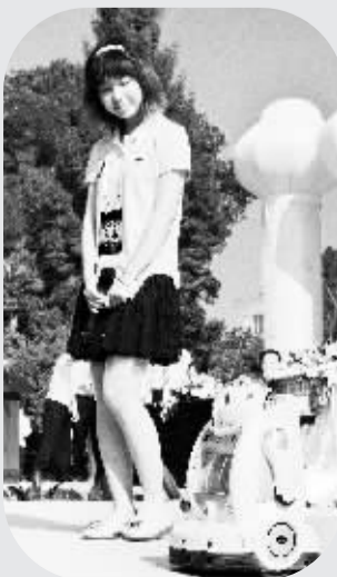
2011中国机器人大赛在兰州举行 8月23日,机器人在2011中国机器人大赛开幕式上进行互动表演。当日,“读者杯”2011中国机器人大赛暨RoboCup公开赛在兰州市举行,全国162所高校的近1000支队伍参赛。

据新华社东京8月23日电 日本研究人员发现,只要重组蚕蛾的一处性信息素受体基因,就能够令它们追逐其他气息。利用这项技术,有可能使蚕蛾成为针对特定气味的高灵敏度传感器。也许不久的将来,蚕蛾能代替警犬充当毒品缉私员。雄蚕蛾依靠微小的性信息素寻找雌蛾。位于雄蚕蛾触角内的受体,能准确捕捉到性信息素,然后将信号传到脑部,从而引起追逐雌蛾的行动。东京大学教授神崎亮平率领的研究小组发现,蚕蛾的性信息素受体和性活动是由一个基因决定的。将小菜蛾的受体基因移植到蚕蛾体内后,蚕蛾便开始追逐雌性小菜蛾。地球上著名的昆虫达上百万种,它们拥有大量独特的受体。如能在这些受体中找到对毒品、炸药、疾病等气味产生反应的受体,并将相应基因移植到蚕蛾体内,就能帮助防止犯罪、诊断疾病等。樱井健志说,蚕蛾分辨信息素的能力和警犬相当,不需要训练,而且培养成本很低。