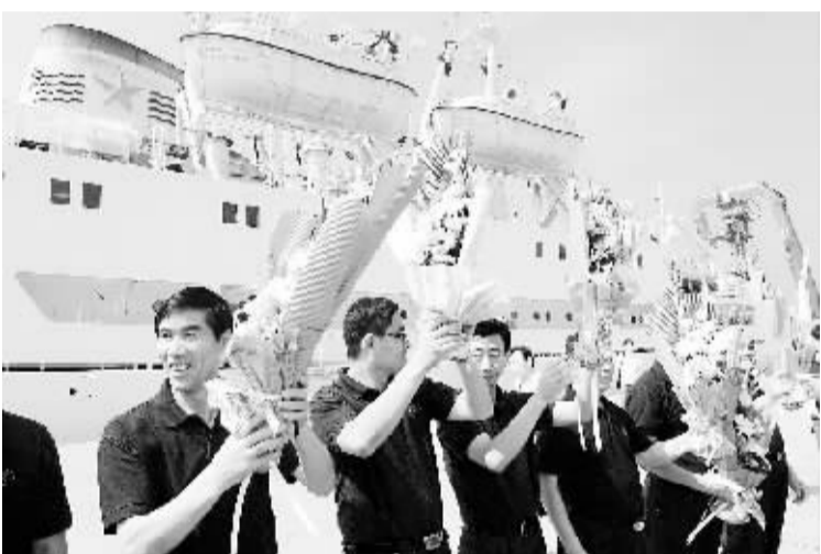
“蛟龙号”母船载誉返回青岛 8月23日,“向阳红09”船只在青岛中苑码头受到欢迎。当日,圆满完成我国载人深潜5000米级海试任务的“蛟龙号”深潜器母船——“向阳红09”船返回青岛。据介绍,国家海洋局北海分局介绍,5000米级海试的完成,标志着我国具备了到达全球70%以上海洋深处进行作业的能力,是我国海洋科技发展史上的一座新的里程碑。