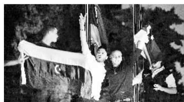
▲约旦和利比亚人在利比亚驻约旦使馆前庆祝 8月22日,在约旦首都安曼的利比亚驻约旦使馆前,约旦人和居住在安曼的利比亚人挥舞旗帜,庆祝反对派武装进入利比亚首都的黎波里。