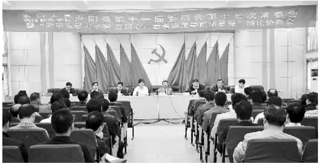
9月15日上午,在淮阳县政协十一届十七次常委会上,政协委员代表,龙湖游船艇主代表,龙湖管理处有关人员,交通、环保部门负责人等10余人围绕“如何加强龙湖管理”这一命题纷纷建言献策。记者了解到,淮阳县政协将好的建议归纳总结成建议案,递交县委、县政府,供决策参考。

会议精神,在教育系统开展学先进、争先进活动;营造尊师重教的良好氛围。 与会教育工作者纷纷表示,要以这次会议为新起点,结合自身工作实际,更好地实践科学发展观,认真贯彻落实“科教兴国”战略,站在培养适应新世纪发展要求的创新型人才的高度,进一步转变教育观念,振奋精神,与时俱进,努力学习,开拓进取,不断提高自身思想素质和业务水平,全面实施素质教育,积极推进新课程改革,努力提高教育教学质量。