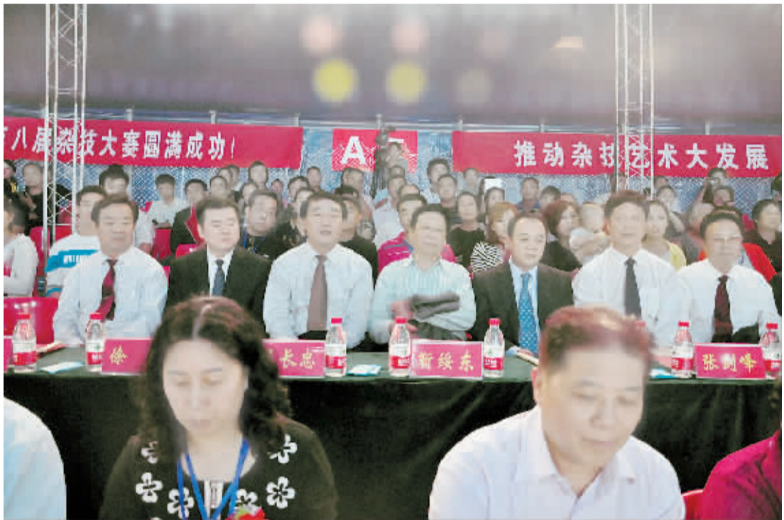
出席开幕式的领导正在观看杂技表演。

据悉,举办此次比赛旨在展示我省杂技艺术的新面貌、新成果,丰富广大人民群众的精神文化生活,推动我省杂技事业的大发展大繁荣。开幕式结束后,省市领导、嘉宾及 1000 多名观众共同欣赏了各代表团表演的精彩节目。