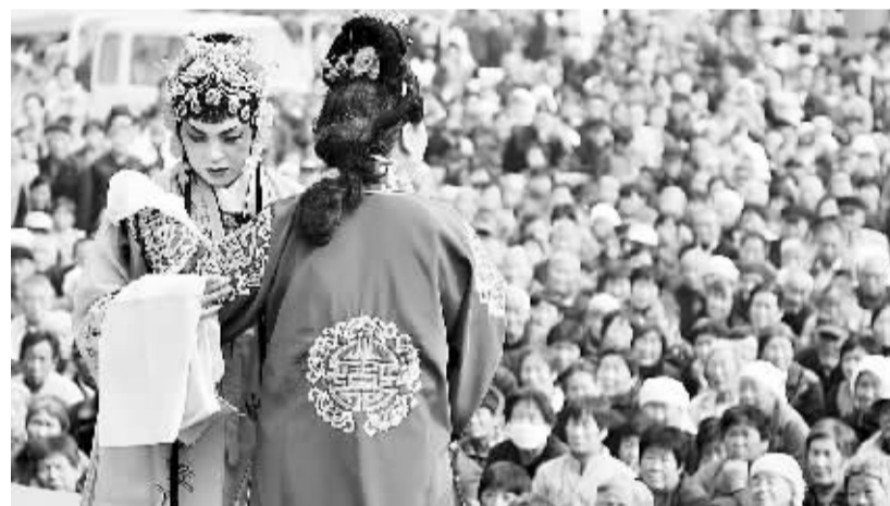
吕剧下乡庆丰收 10月19日,邹平县吕剧团演员在该县孟寺村为村民演出。连日来,山东邹平县吕剧团到该县魏桥镇各乡村进行20余场的庆丰收演出,《王汉喜借年》《小姑贤》等传统剧目让村民在家门口过足看戏瘾。