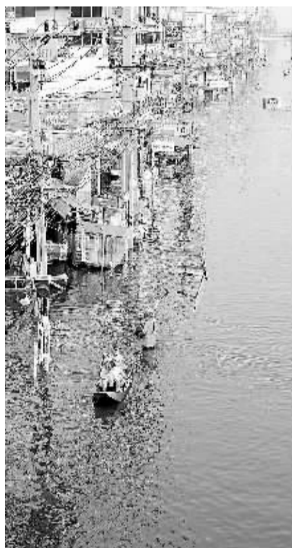
洪水威胁曼谷 10月20日,在泰国首都曼谷市北部相邻的巴吞他尼府的一处街区仍在洪水中。受曼谷市周边各府洪水形势影响,10月19日,曼谷市长素坤攀首次宣布曼谷市的挽肯、塞麦等7个区为洪水可能进入的高危地区。据泰国内政部防灾减灾厅19日通报,持续近三个月的洪灾已致317人死亡,3人失踪,影响到全国77个府中的62个,约900万民众受灾。