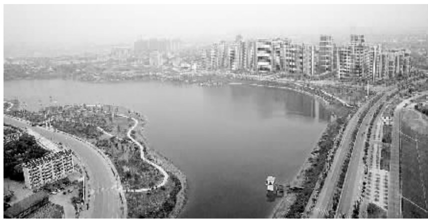
绿色水城等你来 广西南宁市雨雾中的相湖分外美丽(4月28日摄)。10月21日,广西南宁即将迎来第八届中国-东盟博览会,一个文明、和谐、宜居、开放的南宁,正向各界宾朋敞开怀抱。

10月21日至26日,世界目光将再次聚焦广西南宁。第八届中国-东盟博览会、第八届中国-东盟商务与投资峰会将在壮乡首府隆重举行。