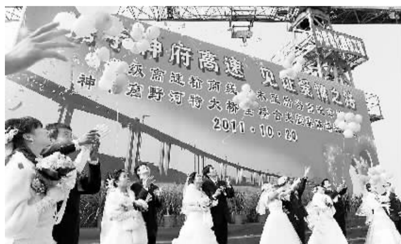
携手高速 见证爱情 10月20日,中铁电气化局西铁公司的10对新人在建设中的大桥上喜结良缘。当日,陕西高速公路榆(林)商(洛)线神木至府谷高速公路重点控制性工程——神木窟野河特大桥梁,历经17个月的艰苦施工如期合龙。陕西省交通建设集团公司特地在距地面近百米的特大桥梁面上,为因建设大桥而推迟婚期的10对新人举办了集体婚礼。