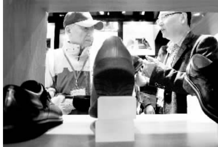
北京国际品牌鞋及配饰展开帷幕 10月24日,一家台湾厂商代表在展台上向观众介绍其推出的实用鞋产品。当日,北京国际品牌鞋及配饰展在北京会议中心拉开帷幕,来自意大利、巴西等国家和地区的近百家制鞋及配饰厂家,展出了国际上最为流行及最具流行发展趋势的各式鞋及配饰。