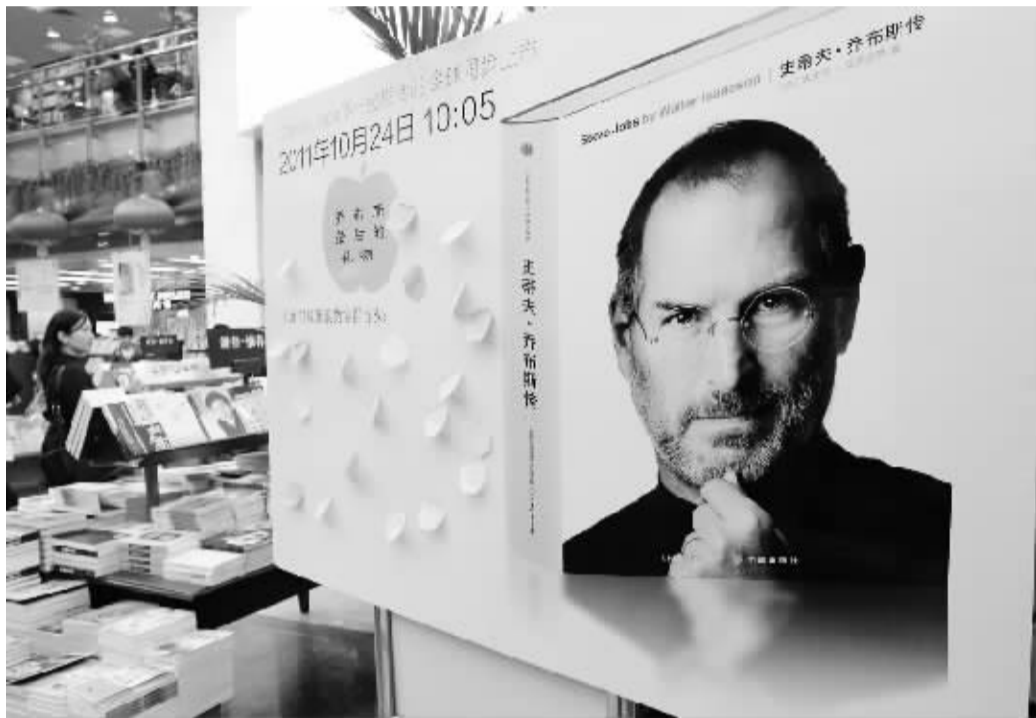
《史蒂夫·乔布斯传》全球同步发行 10月24日,在位于上海福州路的上海书城一楼大厅的留言板上贴着“果粉”对乔布斯的祝福。当日,《史蒂夫·乔布斯传》全球同步发行。该传记由著名作家沃尔特·艾萨克森在过去两年与乔布斯面对面交流40多次,对乔布斯100多位家庭成员、朋友、竞争对手和同事进行采访的基础上撰写而成。艾萨克森是原《时代周刊》主编、CNN董事长兼首席执行官。