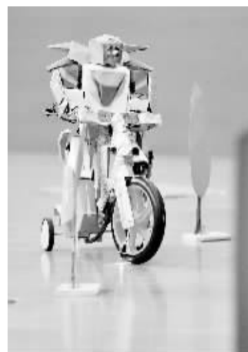
中国科技大学举办机器人大赛 10月23日,在中国科技大学举办的机器人大赛上,一款机器人进行骑行避障表演。右图是一款机器人正在进行攀爬表演。10月22日至23日,中国科技大学第十一届robogame机器人大赛举行,共有52支队伍分两组展开了激烈的角逐。本次大赛分为家庭服务机器人和杂技表演机器人两个主题,参赛选手全部为在校大学生。

际金融危机,国家把技术改造作为重点产业调整振兴的重要措施。2009年、2010年中央投资共安排技术改造专项资金400亿元,安排项目8966项,总投资10210亿元。截至今年三季度,改造项目已累计完成投资7315亿元,完成率92%,已建成投产项目3229项,占全部项目的36%。