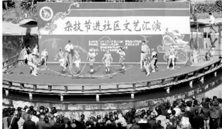
杂技盛会走进社区 10月24日,俄罗斯切列维茨超级斯科克马戏团的演员在石家庄市大马路社区表演杂技《跳绳》。当日,为了让石家庄市更多的社区群众欣赏精彩的杂技节目,正在石家庄举行的第13届中国吴桥国际杂技艺术节组委会专门安排部分外国杂技团体走进社区为群众免费表演,深受群众的欢迎。

瓶颈,实现西藏四季旅游的目标,2004年起西藏开始举办“冬游西藏”活动,开发了一系列高体验、低消费的旅游产品。目前,已经形成鲁布布大峡谷深度游、珠穆朗玛峰之旅、拉萨藏历新年体验游等六大“冬游西藏”品牌。2010年“冬游西藏”活动吸引了国内外游客100多万人次。