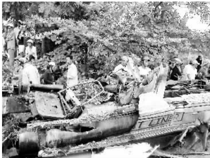
越南南部发生重大交通事故造成30多人伤亡 11月7日在越南平顺省北成顺县拍摄的交通事故现场。在越南平顺省北成顺县发生一起严重交通事故。当天凌晨,一辆由庆和省驶向胡志明市的货车连续与两辆对面驶来的客车相撞,造成两辆客车着火,车上至少10人死亡,23人受伤。

二位的自由民主革新党候选人曼努埃尔·巴尔迪松的得票率为45.52%。佩雷斯是危地马拉自1986年实行民主投票以来第一位军人出身的总统。得知计票结果后,佩雷斯对支持他的民众表示感谢。他说:“谢谢大家对我的支持和信任,是你们给了我危地马拉献身的动力。接下来的4年任期中,让我们一同努力,重新建造一个和平、安定的危地马拉。”