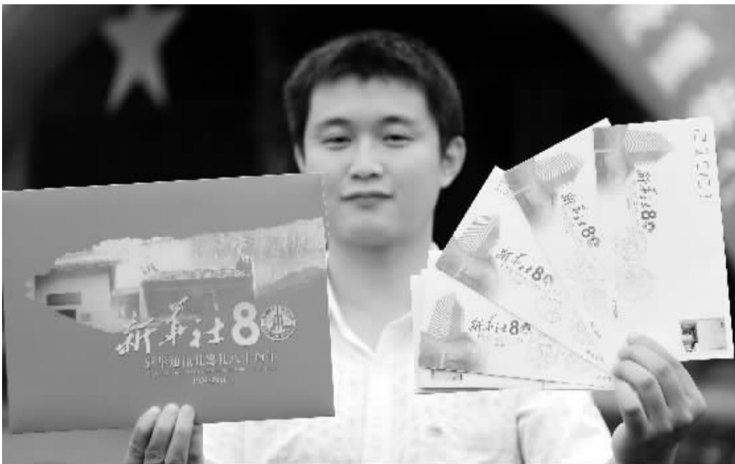
《新华社建社80周年》纪念邮票在江西瑞金首发 11月7日,瑞金市一位市民在展示《新华社建社80周年》纪念章及首日封。当日,《新华社建社80周年》纪念邮票首发仪式在江西瑞金举行。纪念邮票一套4枚,分别为《红色电波》、《抗战号角》、《解放战鼓》、《走向世界》。

业商会发展到包含行业商会、乡镇商会、异地商会、街道商会、市场商会、园区商会、社区商会、楼宇商会、村会等类型的商会组织,全国范围内乡镇商会和街道商会覆盖率已达51.4%和61.5%。黄孟复要求,各级工商联要准确把握当前商会建设工作面临的新形势新任务,坚持培育发展与规范管理并重,制定商会发展规划,明确组建工作的重点领域,加强对商会登记工作的指导与服务。同时,加强商会管理的规范科学,完善指导商会的管理制度,建立商会评价体系,推动商会建设工作迈上新台阶。