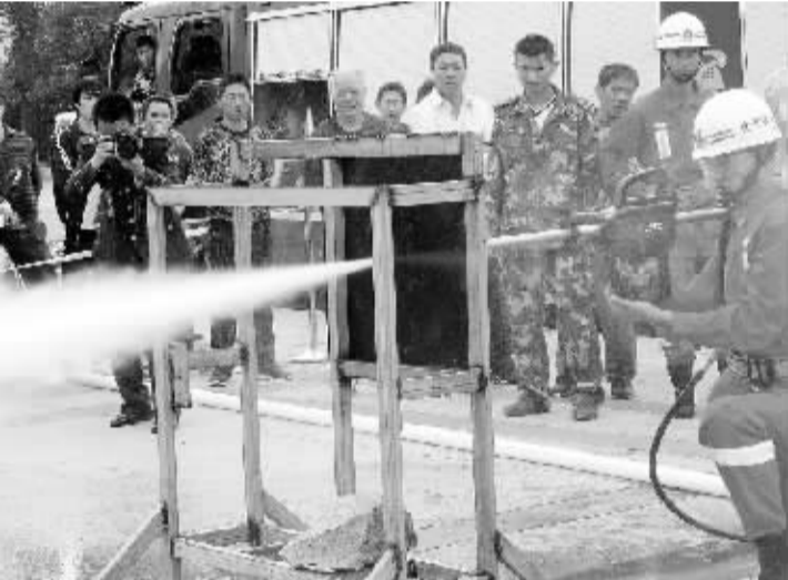
温州消防官兵展特技 11月7日上午,在温州世纪广场举行的消防宣传月活动启动仪式上,温州消防特勤大队官兵演示超高压水枪击穿5毫米厚的钢板。据悉,该超高压水枪可击穿大多数材料制成的墙体,从而进行穿墙式灭火。当日,温州市“119”消防宣传月活动启动仪式在温州市世纪广场举行,消防官兵在现场进行了消防技能展示,多种形式的消防宣传活动吸引了众多市民参与。