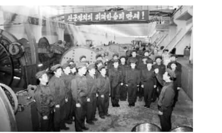
朝鲜工人化悲痛为力量加紧生产。朝鲜最高领导人金正日17日逝世,朝鲜全国哀悼期将持续至29日。

2011年第四季度,中国人民银行对全国50个城市进行了2万户城镇储户的抽样问卷调查。调查认为,房地产投资不再是居民的投资首选,取而代之的是投资“基金、理财产品”,其他依次为“债券投资”和“股票投资”。