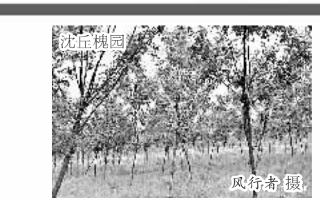
沈丘槐园