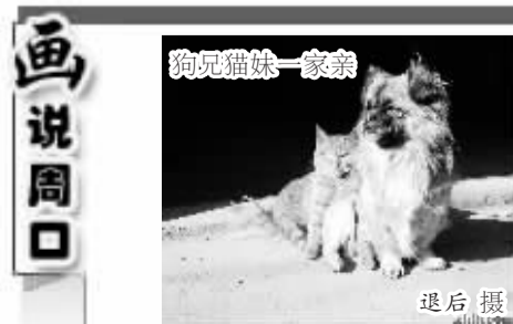
狗儿猫妹一家亲

当然其中也少不了城管和交警为我们规划、规范秩序，所以城市的靓丽形象需要生活在城市里人们的齐心协力，共同努力去创造。 双刃:分析很客观，城市建设需要大家的共同努力。如果我们大家都遵守交通规则，路就不会堵。如果大家多走几步去菜市场买菜，也就不存在小商小贩的占路经营，也就不存在暴力执法。其实交警、城管也都是普通人，他们每天一大早就开始工作，也挺辛苦的，确实应该表扬一下。 喵喵:“创造美好城市”不是一句话的事，它需要许许多多的人共同去创造。环卫、城管、交警等部门在城市的美化过程中做了很多工作。他们同千千万万的市民一起在辛勤努力地工作着。他们的工作或许会给大家带来很多的不便，甚至可能会引起很多不满和抵触情绪。希望大家都能够真诚地去想想，他们都是城市中起得最早的人，每天都能看到他们辛勤忙碌的身影，希望大家能够理解他们工作的辛