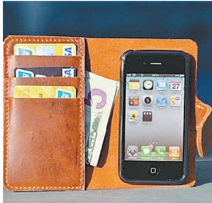
这款手机钱包合体的iPhone钱包保护套是由手工制作而成,采用的材料是牛皮,无论是手感还是细节做工都非常不错,最主要的是保护套的质感非常好。在保护套右侧的手机套材质为硅胶,不会划伤手机,对手机的保护也比较好。(据新华网)

黄庆红写给铁道部的这封信在广大网友中引起共鸣。有网友指出,电话订票、网络购票属于新鲜事物,对于熟悉流程的购票人来说,十分轻松、方便;由于文化水平的差异,许多农民工不会电话订票、网络购票,对于他们来说,难度增加了许多。在售票公开、透明的情况下,造成了农民工购票的困难。有网友呼吁“给农民工一个拼体力的机会吧,这是他们最后的资本了”。还有网友建议,针对农民工的关于网络订票的宣传工作要跟上,雇用农民工多的企业,可以购买一批电脑,或提供单位的电脑室供农民工买票时用。 (肖欢欢 李华)