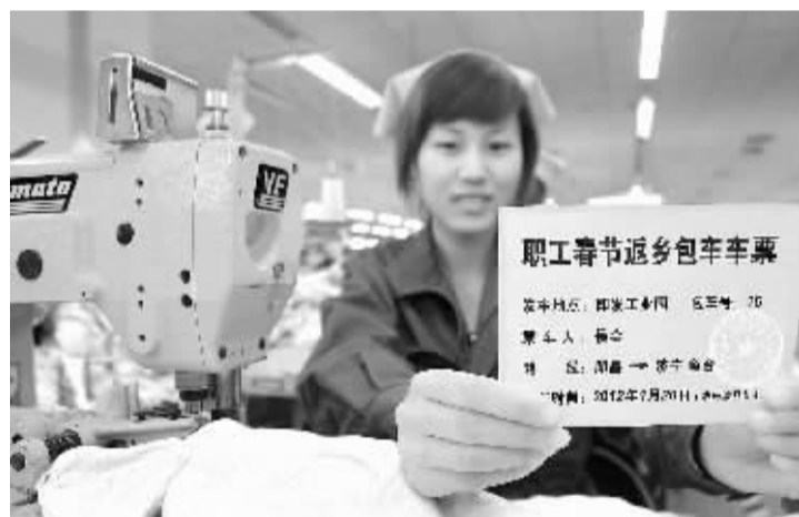
山东即墨:爱心专车助返乡 1月16日,一名青岛的外来务工人员展示回家过年的免费车票。春节前夕,青岛即墨集团成立专门的春运小组,包租大巴,自制车票,免费送该企业山东省内的2000多名外来务工人员回家过年。据悉,这些外来务工人员将于1月20日(腊月27日)乘坐专车返乡。

据新华社台北1月17日电(记者陈健兴 陈斌华)来自台湾铁路管理局的消息,17日8时44分,一列“太鲁阁号”列车与一辆闯越道口的砂石货车相撞,造成砂石车相撞的。当时时速达到130公里的列车车头当场出轨,砂石车被拖行近500米。砂石车司机许宣告不治,另有20余名乘客受