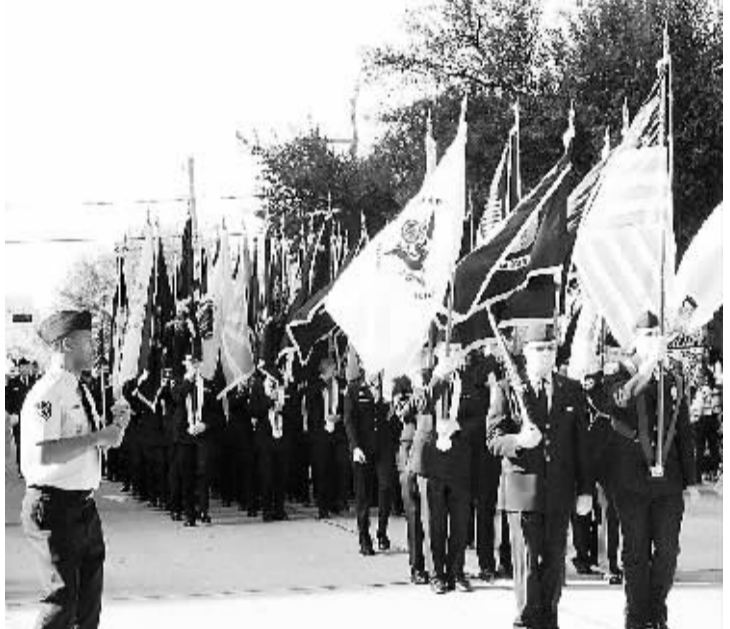
休斯敦举行游行纪念马丁路德金日 1月16日,警察学校仪仗队在美国休斯敦参加游行。当日,休斯敦市中心举行第18届马丁路德金日游行,纪念美国黑人领袖马丁路德金。有10多辆彩车和22支学生军乐团和舞蹈队参加游行,沿途吸引了数万观众。

联合国秘书长潘基文去年11月1日向联大宣布了“人人享有可持续能源”倡议,力争在2030年实现三大目标:确保全球普及现代能源服务,将提高能源利用效率的速度增加一倍,将全球能源消费中可再生能源的比例提高一倍。