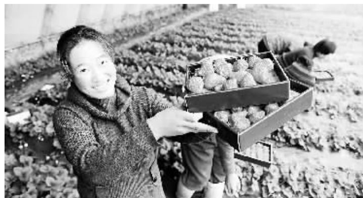
东港农民收获反季节草莓 1月17日,东港市树园镇农民在大棚里采摘草莓。辽宁省东港市树园镇是我国北方冬季反季节草莓的主要供应基地之一,有草莓生产面积2万亩,年产值约2亿元。近年来,树园镇依托日光温室和防治病虫害技术,大力发展种植反季节草莓,产品销路好,利润高,不仅盘活当地经济,还大幅增加了农民收入。

据了解,“十一五”期间,各城市积极参与住房城乡建设部、民政部、中国残联、全国老龄办组织开展的100个城市创建全国无障碍建设先进城市工作,将无障碍建设工作纳入