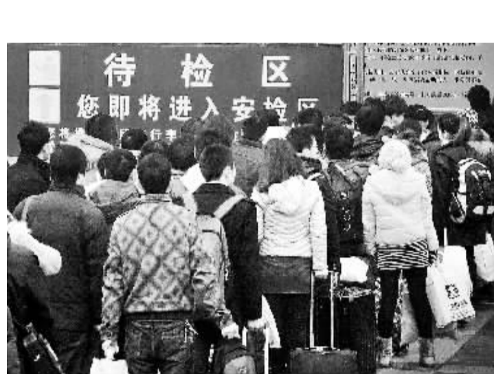
郑州火车站春运秩序良好 1月17日,旅客排队依次进入郑州火车站候车大厅外的安检区。进入春运以来,郑州火车站各项应急措施和便民设施运转正常,车站乘降秩序良好。目前,全站各个关键岗位已经满负荷运转,准备迎接1月20日至22日春节前最后一个客运高峰的到来。

国家统计局数据显示,1至11月份,全国规模以上工业企业实现利润46638亿元,同比增长24.4%。11月份,规模以上工业企业主营业务收入利润率为7%。根据国家统计局数据,分登记注册类型看,国有及国有控股企业增加值比上年增长9.9%,集体企业增长9.3%,股份制企业增长15.8%,外商及港澳台商投资企业增长10.4%。分轻重工业看,重工业增加值比上年增长14.3%,轻工业增长13.0%。分行业看,39个大类行业增加值全部实现比上年增长。