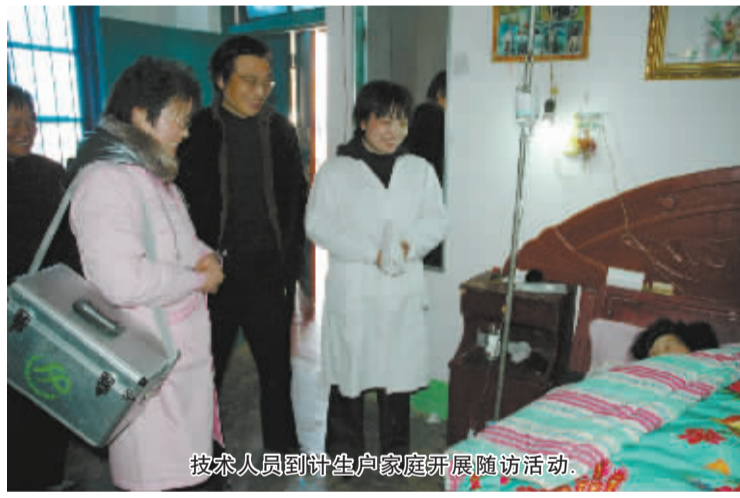
技术人员到计生户家庭开展随访活动