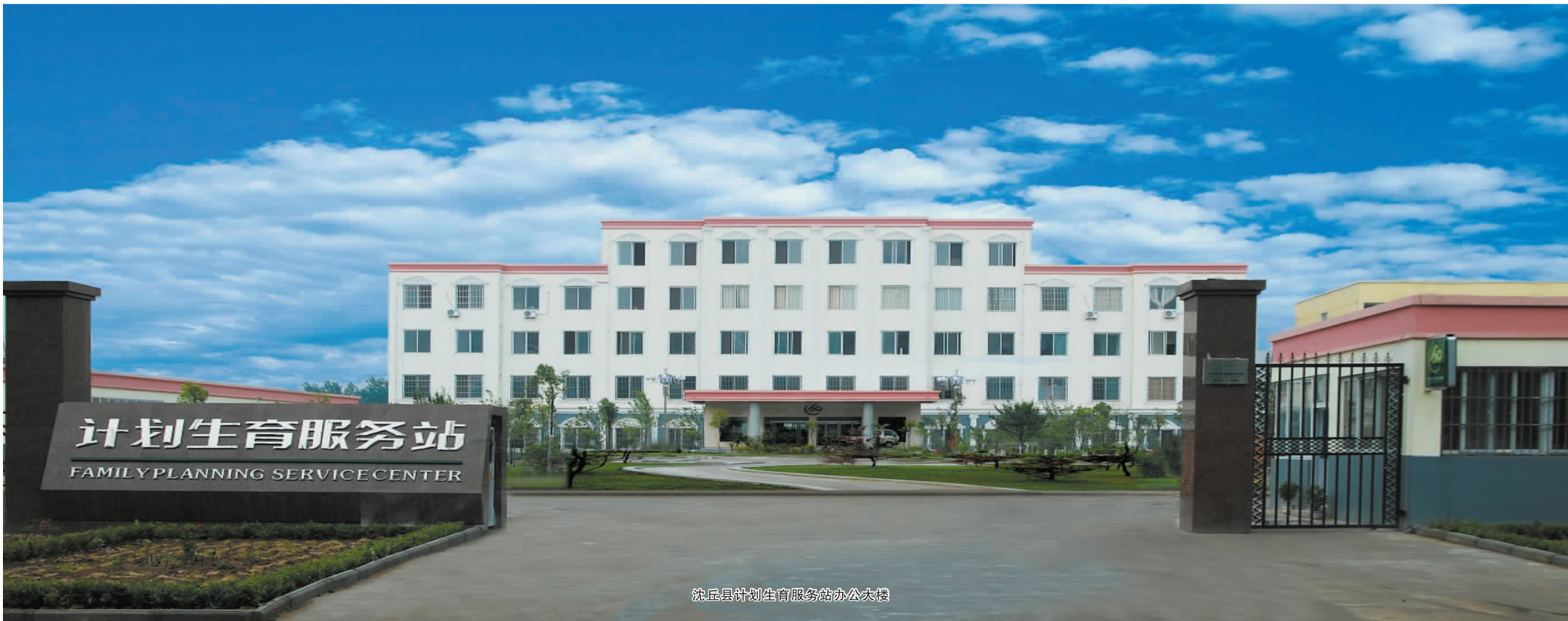
沈丘县计划生育服务站办公大楼