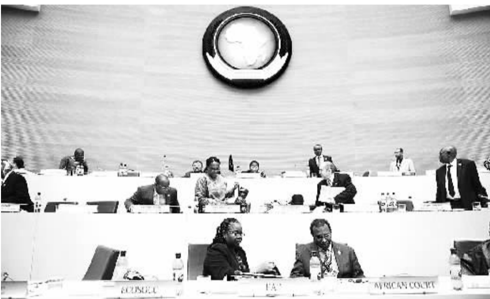
这是1月31日拍摄的与会代表在位于埃塞俄比亚首都亚的斯亚贝巴的非盟会议中心会场内。1月31日凌晨,第18届非盟首脑会议闭幕。

会议期间,非盟委员会主席换届选举四轮投票未见分晓,现任主席、加蓬人让·平与竞争者南非内政部长德拉米尼·祖马均未获当选必需的2/3成员国的支持。会议商定,选举将于6月29日至30日在马拉维首都利隆圭举行的下届峰会上继续进行。选出新领导人前,非盟委员会现任主席、副主席及委员任期顺延。