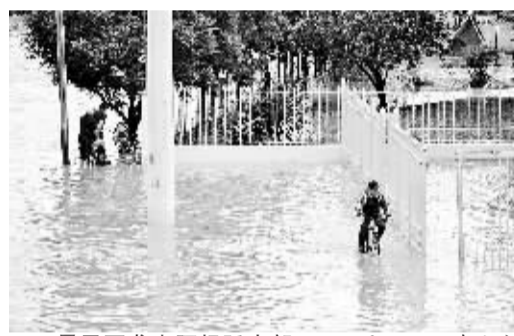
暴风雨袭击阿根廷中部 1月30日,在阿根廷中部城市科尔多瓦,街道被积水淹没。强烈的暴风雨当天袭击了阿根廷中部地区,造成至少1人死亡,15人受伤。