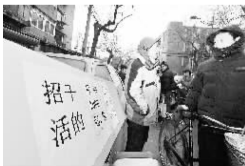
天津举行首场外来务工人员招聘会 1月31日,用人单位在天津市外来务工人员就业服务中心外打出“招干活的”广告牌。当日,天津市外来务工人员就业服务中心举行春节后首场外来务工人员招聘会,解决急于在春节后开工的用人单位岗位多少的问题。由于外来务工人员大多数没有返城,前来招聘的单位存在很大的用工缺口。

春节后是生产招工的旺季,大量企业需要补员,同时,返乡外来务工人员也陆续回城求职。针对这一情况,广州市人力资源市场中心每天将组织用人单位现场设摊招聘,主要涉及机械制造、酒店服务、电子物流、商务营销、企业管