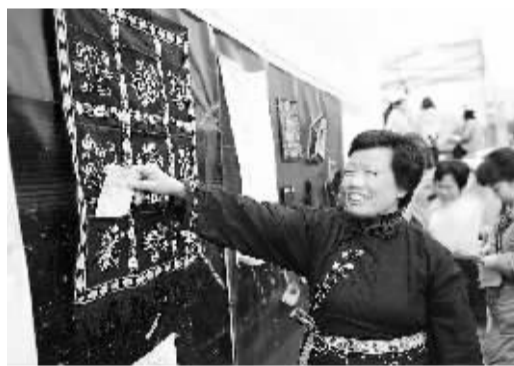
广西罗城侬族同胞秀“非遗” 1月30日,一名侬族刺绣艺人向参观者介绍侬族刺绣“信袋”。当日,广西罗城侬族自治县举行侬族刺绣技艺展示,让更多人了解侬族刺绣文化。“侬族刺绣技艺”2010年被列入广西第三批非物质文化遗产名录。