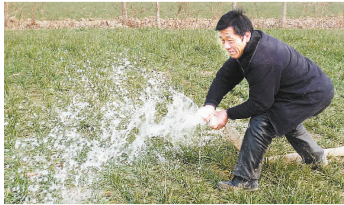
图为商水县练集镇刘楼村的一位农民在浇灌麦田。连日来, 该县广大农民积极进行麦田管理, 确保夏粮丰收。