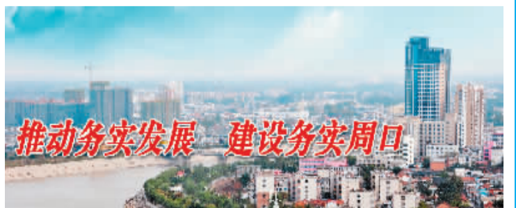
推动务实发展 建设务实周口