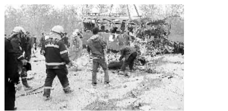
安徽萧县发生客车货车相撞事故,目前已造成至少24人丧生。救援人员正在使用大型吊钩清理现场,并继续搜寻尚未发现的乘客,受伤人员已被送往附近医院救治。

据新华社大马士革4月12日电 叙利亚政府军和反对派武装当地时间12日6时开始实施停火。新华社记者当天在首都大马士革街头采访时看到,当地市民生活一切正常。历时一年多的叙利亚流血冲突能否结束,各方拭目以待。 截至记者发稿时,尚没有叙利亚冲突双方破坏停火的报道。几天前,首都大马士革几乎天天都能听到枪声,但自10日以来,这里没有发生任何枪击事件。 12日上午,大马士革天气晴朗,春意盎然。记者在大街上看到车水马龙、熙熙攘攘的景象。 在大马士革以外的其他城市也没有发生武装冲突。据当地媒体报道,在曾发生动乱的霍姆斯省、哈马省和伊德利卜省,局势平静。在全国第三大城市霍姆斯市,尽管人们还能看到尚未撤出的政府军武装,但没有听到任何枪声。 叙利亚境内反对派“叙利亚全国民主变革力量民族协调机构”(全