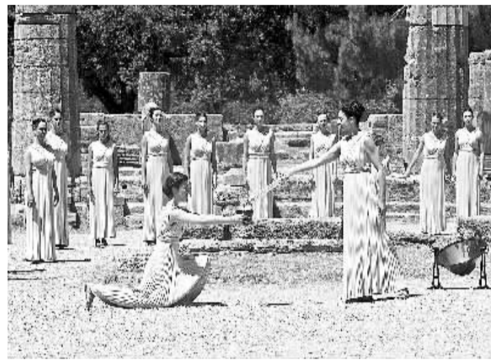
5月10日,最高女祭司(前右)在取火仪式现场将圣火传给奉火女祭司(前左)。当日,伦敦奥林匹克运动会圣火取火仪式在古奥林匹克竞技场举行,随后伦敦奥运会圣火在希腊传递开始。