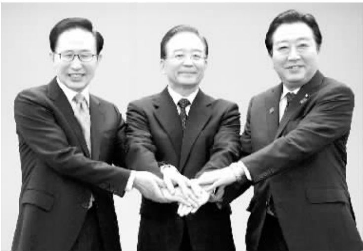
新华社记者 刘东凯

中日韩领导人13日在北京宣布,将于年内启动中日韩自由贸易区谈判。三国合作向前迈出实质性步伐,东亚区域合作掀开崭新一页,实为造福亚太惠及全球的好事、大事。 合作水平提升是三国相向而行的切实成果。自1999年启动以来,经过13年的不懈努力,中日韩合作已成为三国巩固睦邻友好、扩大共同利益的重要平台。5次领导人会议,18个部长级会议,50多个工作组对话,中日韩合作秘书处建成,中日韩投资协定正式签署。三国合作扎实推进,机制不断完善,内容日益充实,水平显著提升,如今已经站到新的历史起点上。