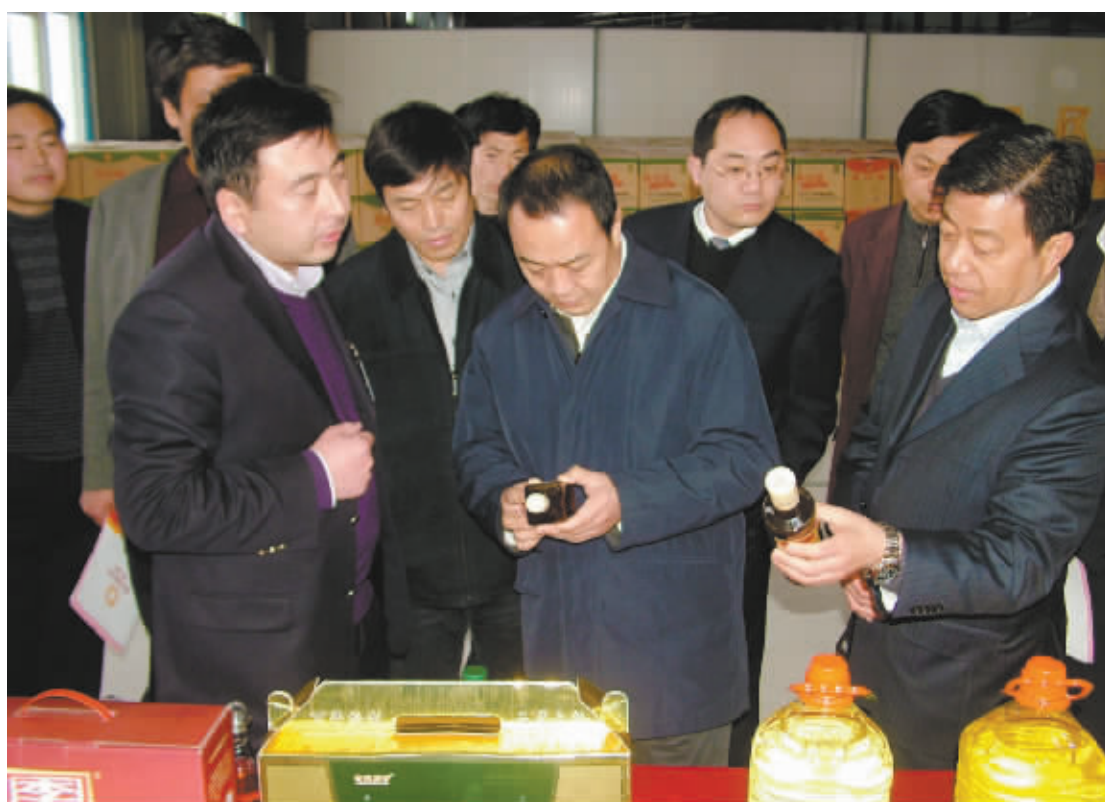
省委常委、政法委书记毛超峰在副市长杨廷俊陪同下深入企业调研