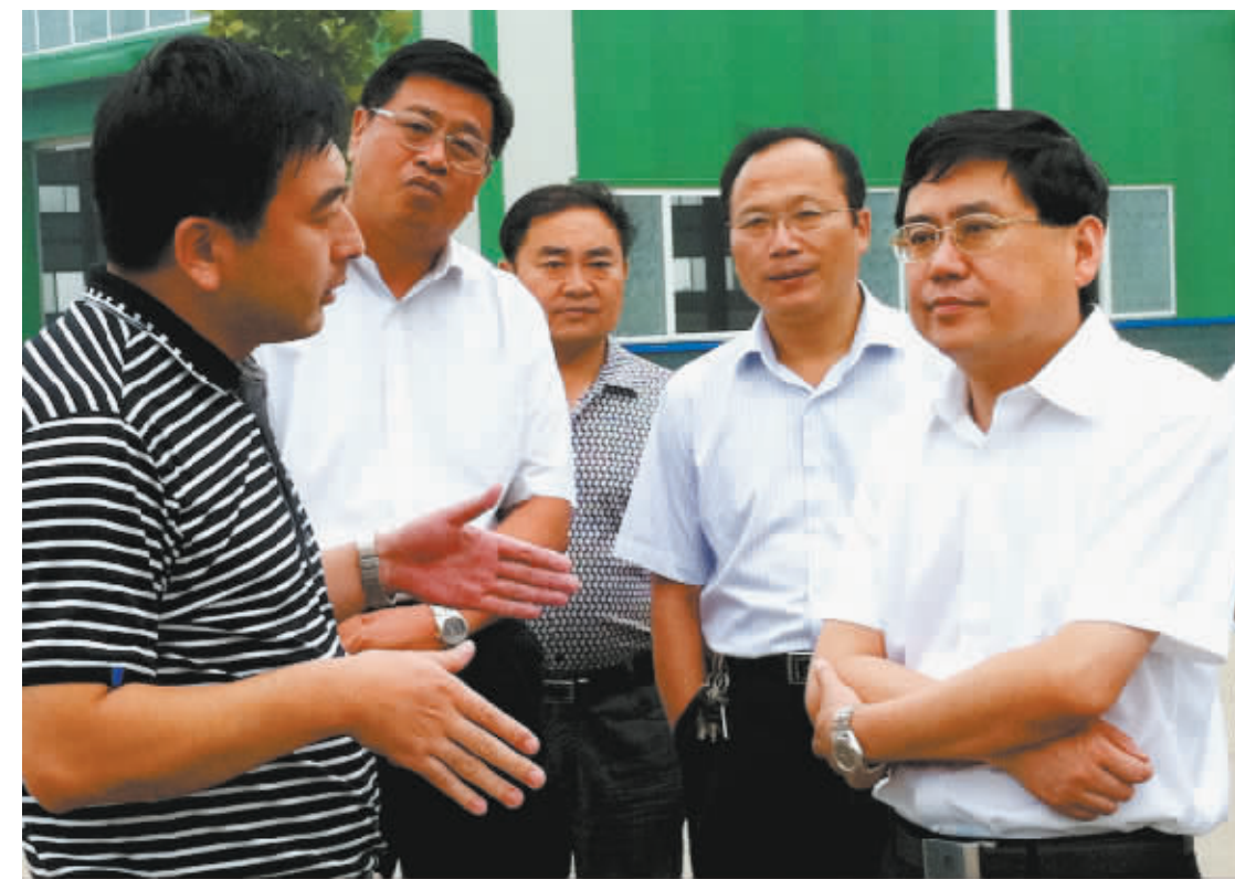
市委常委、鹿邑县委书记陈志伟等领导深入企业调研,并听取企业运行情况汇报