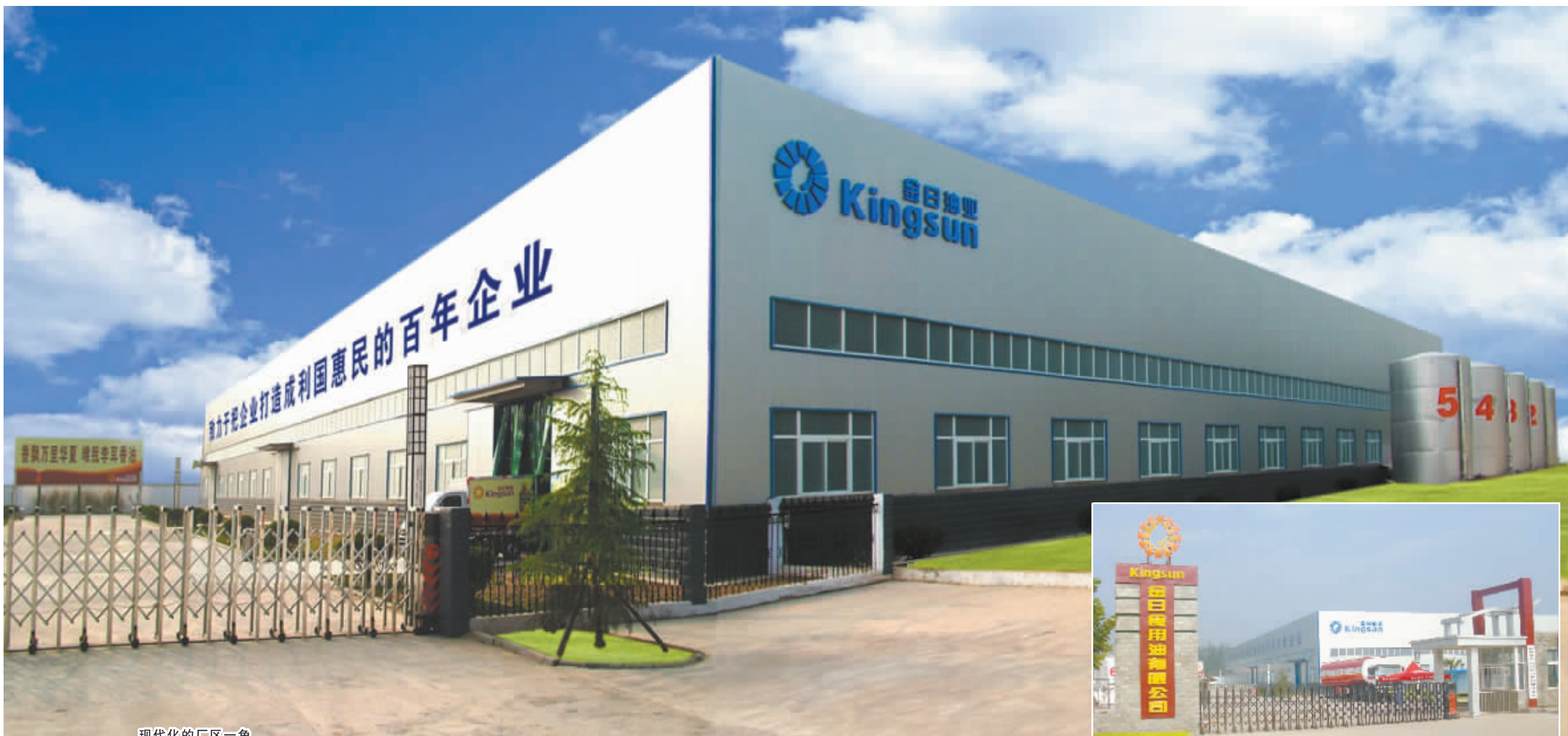
现代化的厂区一角