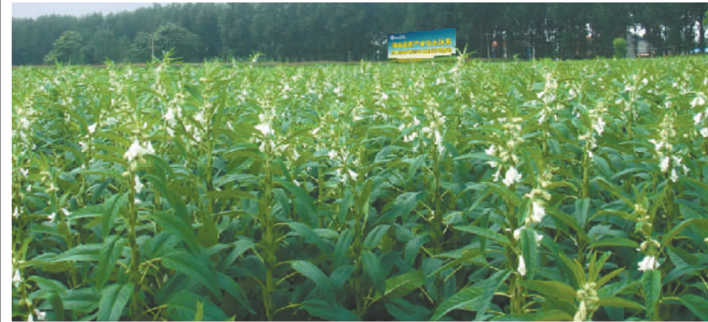
全国芝麻产业技术体系、周口综合试验站金日油业芝麻种植基地

鹿邑县金日食用油有限公司创建于2005年3月,位于世界历史文化名人老子故里——鹿邑工业集聚区,南靠311国道,北临许亳高速公路,东接京九铁路,交通便利,资源丰富,具有食用油深加工得天独厚的条件。公司注册资金4000万元,厂区占地面积98600平方米。公司拥有员工200余人,其中高、中级技术人员50余名,拥有传统石磨香油生产设备和国内先进的360层过滤设备及试验检测仪器等200多(台)套,年生产一级食用大豆油30000吨和传统石磨香油5000吨,是鹿邑县唯一一家植物食用油生产、加工、销售为一体的民营企业。省长郭庚茂,省要常要,统战部长史济春,省要常要、政法委书记毛超峰以及周口市委书记徐光等领导先后莅临金日油业生产基地参观考察,对金日油业生产经营及发展速度给予了高度评价。 几年来,公司始终坚持“弘扬老子古文化、享受金日好生活”的经营理念,致力于石磨香油、大豆油、调和油等产品的生产和创新,打造从农田到餐桌的绿色有机产业链。主导产品李耳石磨香油主要采用优质芝麻原料和传统的石磨生产工艺,运用水代法提取香油,并加360层过滤工艺,生产出色香味俱佳的优质香油。目前公司拥有“李耳”牌石磨香油、大豆油、调和油及“绿漾今香”等品牌大豆油、花生油及高级营养调和油20多个品种,一流的产品质量和良好的售后服务深受广大客户和消费者中有口皆碑,“金日”人用真诚与奉献赢得了广大消费者的信赖,走进了千万消费者的家中。主导产品主要销往北京、安徽、上海、山西、天津、湖北等10多个省市自治区及本省各县市区各大超市和周边市场,并与中国移动周口公司、富士康、思念食品等建立了长期的合作伙伴关系。