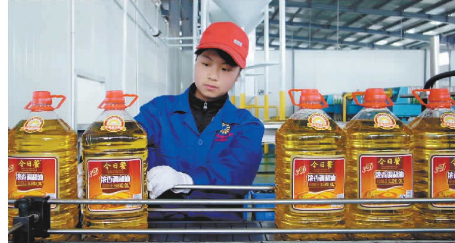
现代流水包装生产线