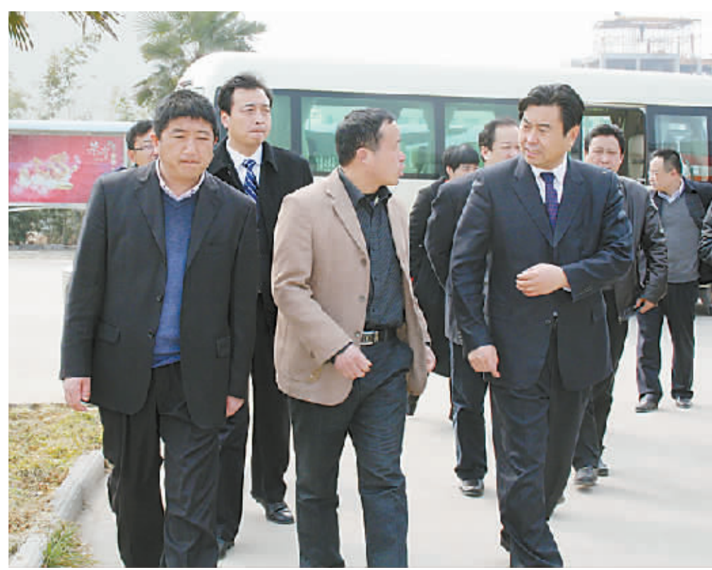
市委副书记、代市长岳文海在县长朱良才的陪同下深入企业调研