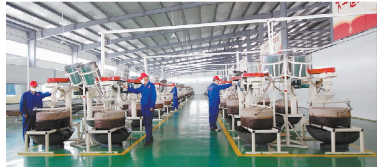
石磨香油生产车间